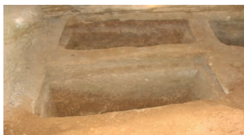
Рис. 3 Погребения в пещере №19