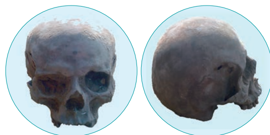
Рис. 7. Череп №3