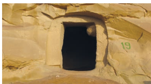
Рис. 2 Пещера №19, вход