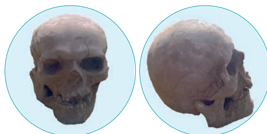
Рис. 6. Череп №2