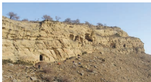
Рис. 1 Панорама на пещерные монастыри Кешикчидага