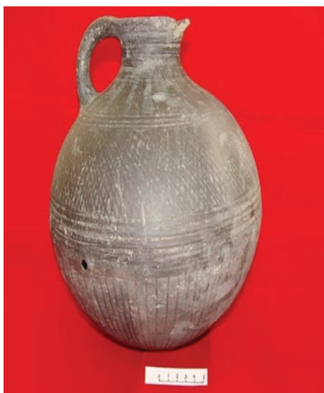
Рис. 8. Керамические сосуды из кургана