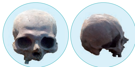
Рис. 5. Череп №1

Человеческий костяк в погребении отсутствовал. В некоторых памятниках Ходжалы-Кедабекской археологической культуры, распространенной в западном регионе Азербайджана, человеческий костяк