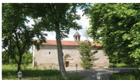
Нидж. Церковь Св. Елисея «Чотари»