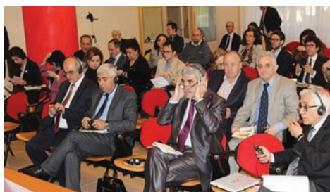
На международной конференции «Азербайджанский мультикультура- лизм и Кавказская Албания (удины)». Рим. 21.04.2015