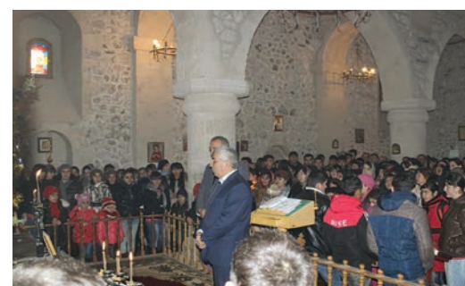
Пасха (07.01.2017) – Церковь Св. Елисея «Чотари» – Рождество Христово (02.05.2018)