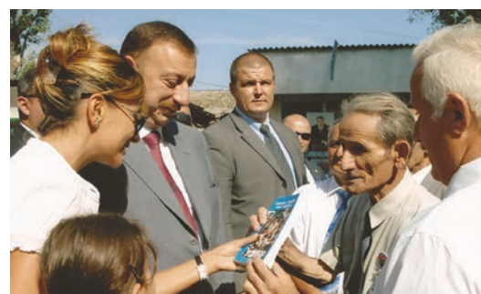
Нидж. Официальный визит Президента Азербайджанской Республики Ильхама Алиева (18.08.2005)

Дополнительные свидетельства о жизни христиан на территории Кавказской Албании дают имена раннехристианских святых епископов, что и подтверждают археологические находки. Известны мученики первых веков христианства: святые Варфоломей [6; с.122], Фаддей, равноапостольский святой Елисей, его ученики и др. Христианские захоронения на территории компактного проживания удин, памятники христианского наследия, древние археологические находки, являются ярким свидетельством наличия христианской общины в регионе современного Азербайджана. В различных районах страны зафиксированы и найдены христианские базилики V–VI вв., а из актов Вселенских и Поместных Соборов известны епископы Албании. Сохранился полный список албанских католикосов. Существует различия в архитектуре храмов, символах креста, элементах христианства, представителей духовных глав и католикосатская линия. Приведенные данные показывают довольно развитую церковную организацию, богослужения, а также возникновение новых епископств при сохранении старых. Сохранились также имена иерархов, которые представляли Албанскую Церковь на Вселенских Соборах, мощи которых сохранились в одноименных монастырях.