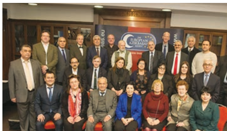
На международной конференции «Конфессии на Кавказе» Лондон. 3–4. 03. 2014