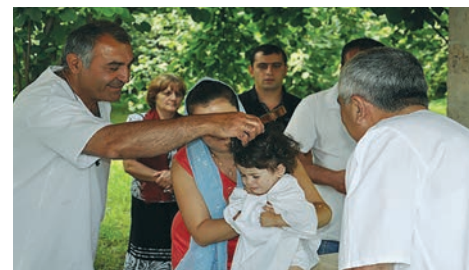
Огуз. Церковь Св.Елисея «Кала Гергец» Таинство Крещения.

После октябрьской революции в России, на всей территории империи и на Южном Кавказе, в том числе, к власти в стране пришли атеи-