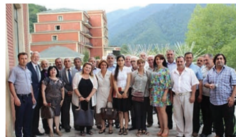
На международной конференции «Албанская Апостольская Церковь: прошлое и настоящее» Габала. 20.08.2016

Во имя воссоздания исторической справедливости и с гуманистических критериев восстановления нарушенных или подвергшихся деформации национально-религиозных отношений, сегодня остро стоит вопрос о возрождении статуса Албанской Церкви на основе удинской паствы – как единственного христианского право-преемника этого богатого конфессионального наследия. Деятельность двух Албано-удинских общин, полный перевод основных глав Библии и литургии на родной язык, реставрация церквей и подготовка священнослужителей – это первый шаг к возрождению Албанской Автокефальной Церкви. Сегодня удины-христиане являются одним из феноменов в сохранении этого наследия в модели мультикультурализма и сотрудничества различных конфессий и культур, а Нидж и Огуз – места компактного проживания удин, является ярким образцом этого, что дает предпосылку и реальную правовую основу статусу Албанской Церкви в Азербайджане.