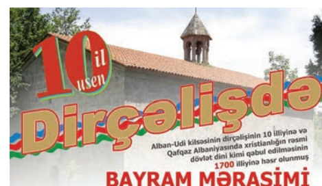
1700-летие принятия христианства Кавказской Албанией как государственной религией. Нидж. 2013