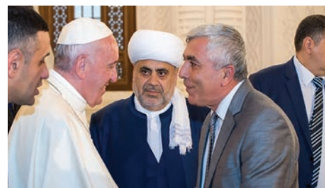
Визит Римского Папы Франциска. Баку. Мечеть Гейдара Алиева. 02.10.2016