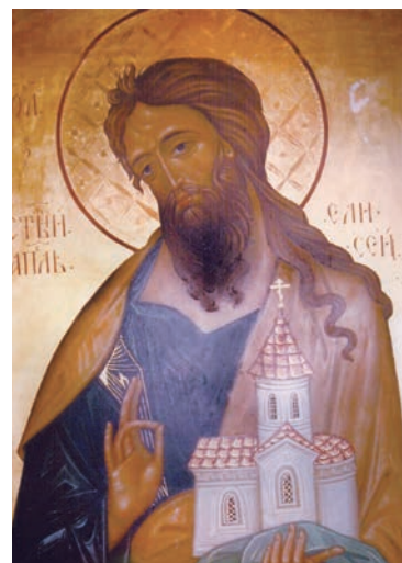
Равноапостольский Святой Елисей