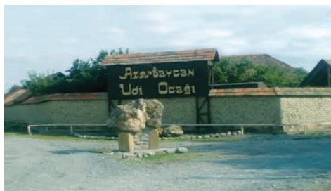
Нидж. Азербайджанский Удинский Оджа