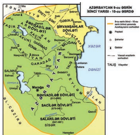
Рис. 1. Азербайджан в IX–X веках