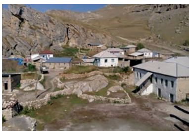
Рис. 2. Общий вид села Крыз

выращивали рис. «Джан ай хыр» – «хыр» в конце также раскрывает значение этого выражения. Хотя это и не было написано в источниках, согласно информации, полученной во время этнографической экспедиции, ветви Гобугырагы и Меммедрзабейоба также мигрировали в это же время. «Гобу» означает «колодец». Этот колодец был расположен в области, похожей на яму, и в нем всегда была вода. Связь между ветвями Гобугырагы и Мурсалигышлагы и ветвями, живущими в селе Верхний Алык, существует и по сей день. Династии Джанахыр, Мегралыгышлаг, Мурсалигышлаг, Гобугыраг поселились в одноименных селах Хачмаза [2].