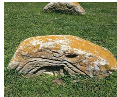
Рис. 3. Надгробные камни