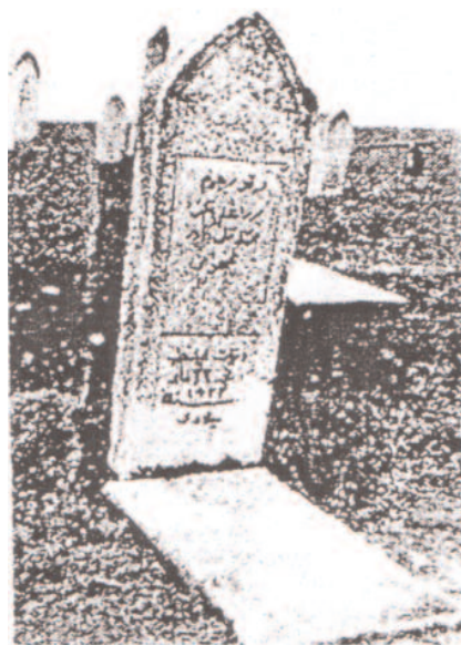
Şəkilde: Ağcabədi rayonunun Kəhrizli kənd qəbristanlığında Mirzə Ələkbər Məmmədquluzadənin məzarı

tərmışəm, onların xoşuna gəlib. İndi yenə tapıb oxuyacam