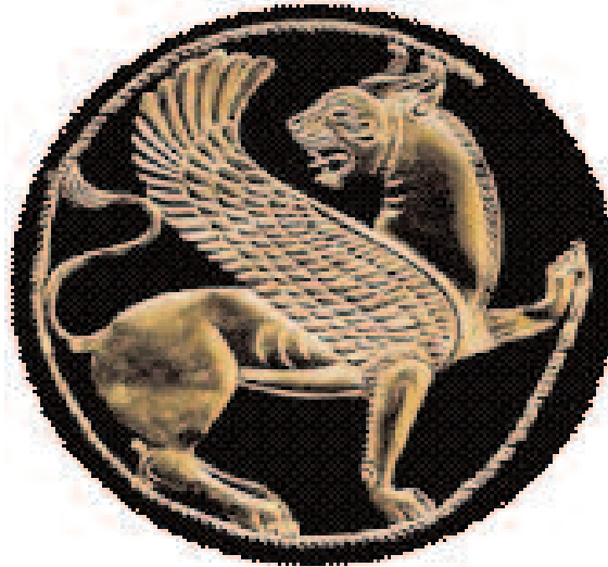
Qədim parsların rəmzi

əksəriyyətinin şəcərəsi ata və ya ana xətti ilə məhz Böyük Kirə bağlanır. Şah İsmayıl Xətai ilə Böyük Kir arasındakı paralellərdən bəzilərinə bəlkə də bu müddəə ilə izah etmək olar! Yüzlərlə paralelin sadalandığı bu əsərlə tanış olanda düşünürsən ki, tarixin təkrarlanması müəyyən qanunauyğunluqlara əsaslanır və sistemli xarakter daşıyır. Müəllifin təqdim etdiyi və məntiqi cəhətdən əsaslandırılmış faktlar göstərir ki, Səfəvi