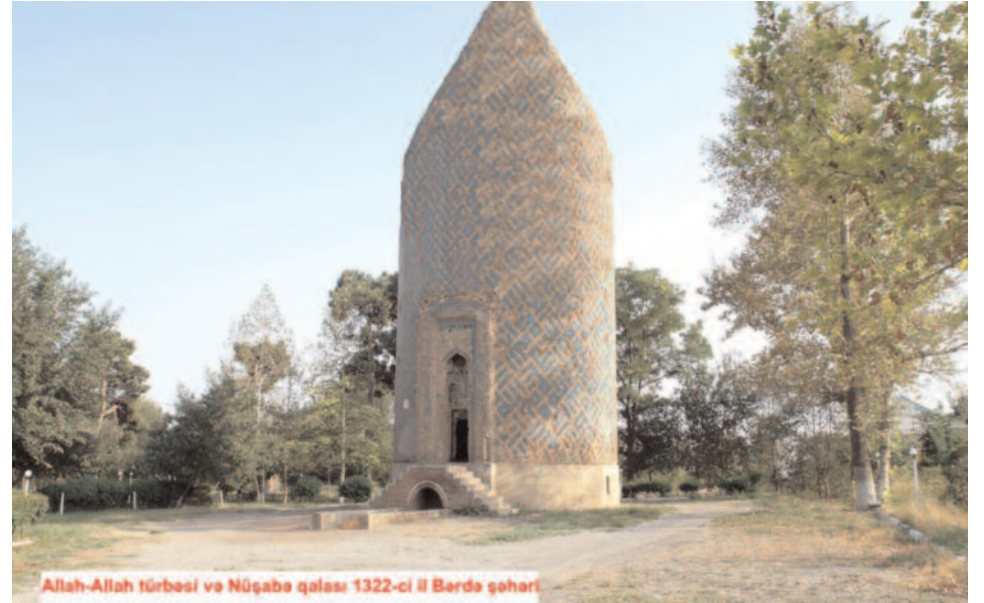
Allah-Allah türbəsi və Nüşaba qalası 1322-ci il Bərdə şəhəri

AZƏRBAYCAN RESPUBLİKASININ PREZİDENTİ YANINDA KÜTLƏVİ İNFORMASIYA VASİTƏLƏRİNİN İNKİŞAFINA DÖVLƏT DƏSTƏYİ FONDUNUN MALİYYƏ DƏSTƏYİ İLƏ DƏRC OLUNUR