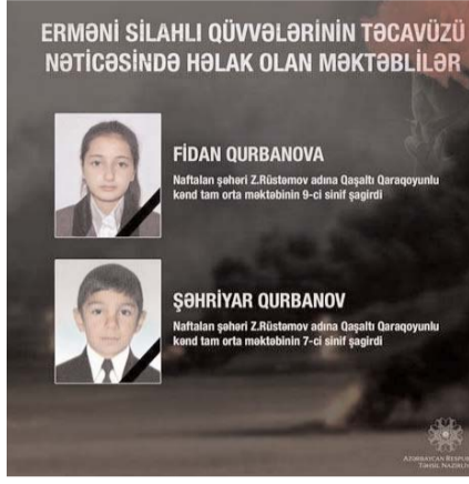
ERMƏNİ SİLAHLI QÜVVƏLƏRİNİN TƏCƏVÜZÜ NƏTİCƏSİNDƏ HƏLƏK OLAN MƏKTƏBLİLƏR