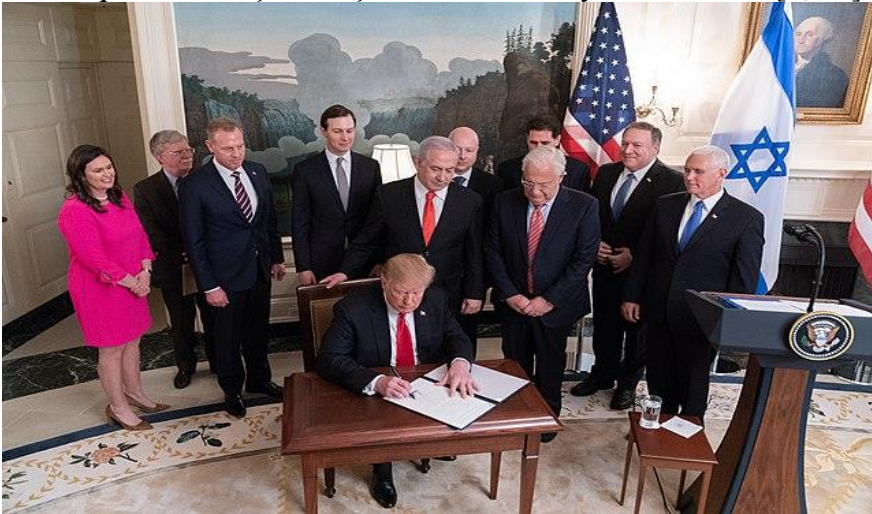
ABŞ prezidenti D.Tramp Colan təpələri üzərində İsrailin suveren hüququnu tanıyır. 25 mart 2019-cu il.

- Prezident D.Tramp 2020-ci ilin yanvarında Fələstin probleminin həlli ilə bağlı yeni sülh planını açıqladı (Plan “Sülh görüşü” və ya “Çiçəklənmə üçün sülh” adlanırdı). Ümumilikdə, İsrailin mənafeyinə uyğun olan bu plana əsasən, İordən çayının Qərb sahilinin 30%-i və İordaniya vadisinin mütləq əksəriyyəti Qüdsün böyük hissəsi daxil olmaqla İsrailə verilməli, Qəzza sektoru və İordən çayının Qərb sahilinin 70%-ni əhatə etməklə və Əbu-Dis və ya Şərqi Qüds paytaxt olmaqla hərbsizləşdirilmiş Fələstin dövləti yaradılmalı idi [9; 10].