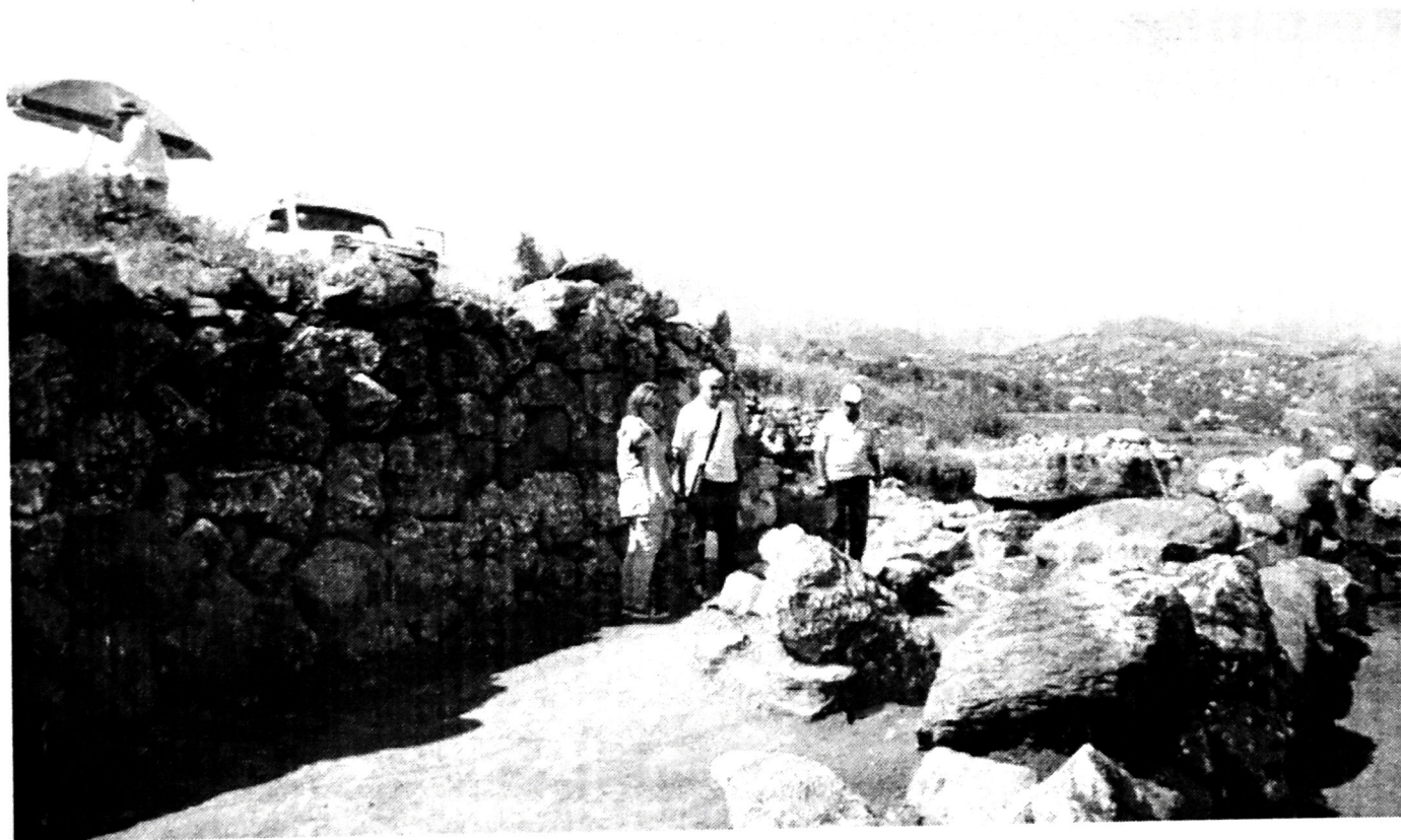
Şəkil 1. Son Tunc - Erkən Dəmir dövrünə aid qala divarları