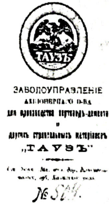
Рис. 2. Фотокопия титульного листа Заводуправления «Таузъ». 1913 г.