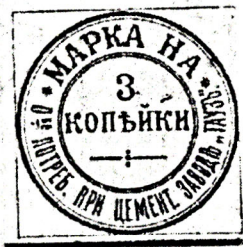
Рис. 3. Марка. 3 копейки.