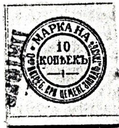
Рис. 4. Марка. 10 копеек.