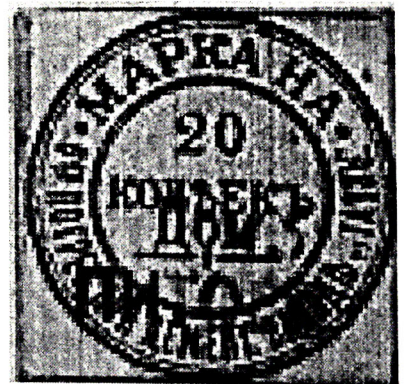
Рис. 5. Марка. 20 копеек.