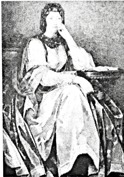
Şək. 2. Oqtay Sadiqzadə. Natəvan. Kətan, yağlı boya. 1983.