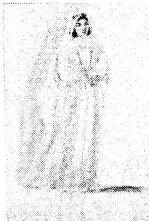
Şək. 1; 2.