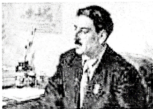
Böyükağa Mirzəzadə – İsmayıl Axundovun portreti (1956)