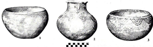
Şəkil 2. Monoxrom boyalı qablar. Qızqala. 8 № li kurqan.

Şərqi Anadolunun Orta Tunc dövrü mədəniyyətinin öyrənilməsinə boyalı keramika məmulatı əsas yer tutur. Əsasən dulus çarxında hazırlanmış olan keramika məmulatı monoxrom və polixrom boyalılar olaraq iki qrupa ayrılır. Şərur rayonunun qəbir abidələrinə görə Şərqi Anadolu məzarlarından polixrom boyalı qablar daha çox aşkar olunmuşdur. Polixrom boyalıları hazırlanmasına və bəzəmə motivlərinə görə fərqlənirlər. Qabların ən diqqət çəkən xüsusiyyəti isə naxışlanmış hissələrinin çox yaxşı cıllanmasıdır. Qablar əsasən həndəsi naxışlar, dağ keçisi, su quşu və digər fərqli heyvan motivləri ilə naxışlanmışdır [12, s. 360]. Şərur və Şərqi Anadolunun monoxrom boyalı keramika məmulatları arasında oxşarlıq daha çoxdur.