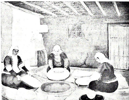
Şəkil 2. Ləvəşəpənlər.

Görkəmli rəssamın təbiət təsvirlərində, köhnə Naxçıvanın tarixi yerlərini əks etdirən tablolarında, məişət mövzusunda yaratdığı əsərlərində, doğma diyarımızın etnoqrafik xüsusiyyətlərini əks etdirən rəsmlərində portret janrı aparıcı janrlardan biri kimi diqqət cəlb edir. “Qaçqınlar”, “Molla məktəbi”, “Ləvəşəpənlər”, “Çörəksatan”, “Küçə dəlləyi”, “Çarıqlılar”, “Naxçıvanda köhnə həyat”, “Örtülü bazar”, “Köhnə qala”, “Gac dəyirmanı”, “Qalayçılar”, “Öküzlərin nallanması”, “Taxılbiçənlər”, “Naxçıvan hamamı” və s. rəsmlərində müxtəlif janrlardan istifadə etməsinə baxmayaraq yenə də konkret olmayan obrazlar, portretlər diqqət mərkəzindədir.