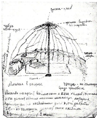
Рис. 2. Рисунок интерьера мобильного жилья «kafarcıq» с покрытием из войлока.

Во внутреннем убранстве жилища низ стен покрывали камышовыми циновками, а сверху для утепления, войлоком «уап qəlibləri» (азерб. – боковые войлоки). Таким же образом застилали и пол во всех разновидностях жилищ азербайджанцев. Особому оформлению подлежало изголовья жилища – место перед ложей «тахт» (тахт), где восседал глава семьи; здесь же принимали гостей. Этим самым обозначался смысловой и композиционный центр жилища. Поэтому это пространство – и пол, и стены – застилали большими и лучшими ковровыми изделиями. Войлок, специально изготовленный для настила на пол, размером примерно 2,5×1,5 м из белой или серой шерсти, называли «немед» (nəməd) [1, с. 88]. Для трапезы скатерть расстилали на полу, устланном ковром или войлоком. На ночь пол ложе «тахт» застилали дополнительным войлоком или циновкой и укрывали толстым ватным одеялом, на котором спали. Все постельные принадлежности и другая домашняя утварь наутро складывались на покрытое войлоком или паласом сооружение у стены – «тахт», сложенное из камней, кирпичей или бревен [2, с. 46]. А в самых бедняцких жилищах войлок заменял и ковры, и постель.