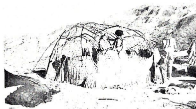
Рис. 1. Установка «алачыгы» с войлочным покрытием.

В Азербайджане археологический материал по войлоку отсутствует, но об изготовлении и использовании его для шитья верхней одежды мы узнаем от авторов, изучающих древность. Так, в III в. до н.э. в Мидии носили удлиненные шапки «тиары» из войлока [5, с. 364], одежда албанских воинов также изготовлялась из войлока. Рубук, проезжавший через половецкие степи в середине XIII столетия, упоминает о «черных войлоках», в которые скотоводы «закутываются» во время дождя [7]. Помимо одеяния, войлок широко употреблялся в обустройстве жилища.