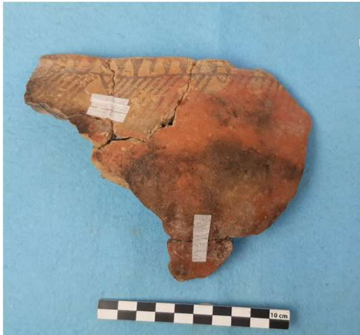
Şəkil 3. Orta Eneolit dövrünün boyalı keramikası (Uçan Ağıl).

yəti üçün xarakterik olan bir-biri üzərində yerləşdirilən üçbucaqlarla bəzəmə və həndəsi motivdə naxışlanmış keramika diqqətçəkicidir. Keramika nümunələrinin bəziləri relyef kəmərlər üzərindən barmaq basqısı ilə naxışlanmışdır. Bu tip keramika nümunələri Culfa Kültəpəsinin VII təbəqəsindəndir [11, s. 113, fig.12, 9-10; s. 116, fig. 15, 5]. Keramika nümunələrinin araşdırılması onların e.ə. V minilliyin birinci yarısına və OvçularTəpəsindən [10, s. 108-121] və Sirab abidələrindən [8, s. 88-95; 9, s. 136-145] əvvələ aid olduğunu təsdiq edir. Bu, abidədən götürülən karbon nümunələrinin analizi ilə də təsdiq olunmuşdur. Karbon analizlər e.ə. V minilliyin birinci yarısını göstərmişdir (e.ə. 4690-4450). Uçan Ağıl, Uzunoba və Bülövkaya yaşayış yerlərindən Culfa Kültəpəsindən məlum olan Dalmatəpə tipli boyalı keramika parçalarının aşkar olunması bu yaşayış yerləri arasında əlaqələrin olduğunu təsdiq edir.