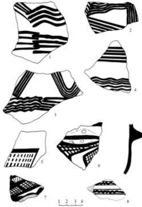
Şəkil 1. II Kültərə yaşayış yerinə aid keramika məmulatı.