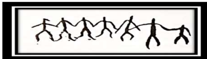
Qobustan, 29 №-li daş üzərində yallı oynayanlar.

Qədim türk etnosuna məxsus müxtəlif görüş və etiqadlar, təfəkkür və əxlaq tərzləri yallı və halay rəqslərində bu və ya digər dərəcədə öz əksini tapır. Ona görə də bir çox mənbələrdə yallıların həm də müxtəlif kultlar, törənişlərlə bağlı yozumları da vardır [1, s. 405]. Yallıların Tanrıçılıq görüşləri ilə bağlı olması haqqında fikirlər yallının qədim mifoloji görüşlərlə bağlı olmasını təsdiq edir.