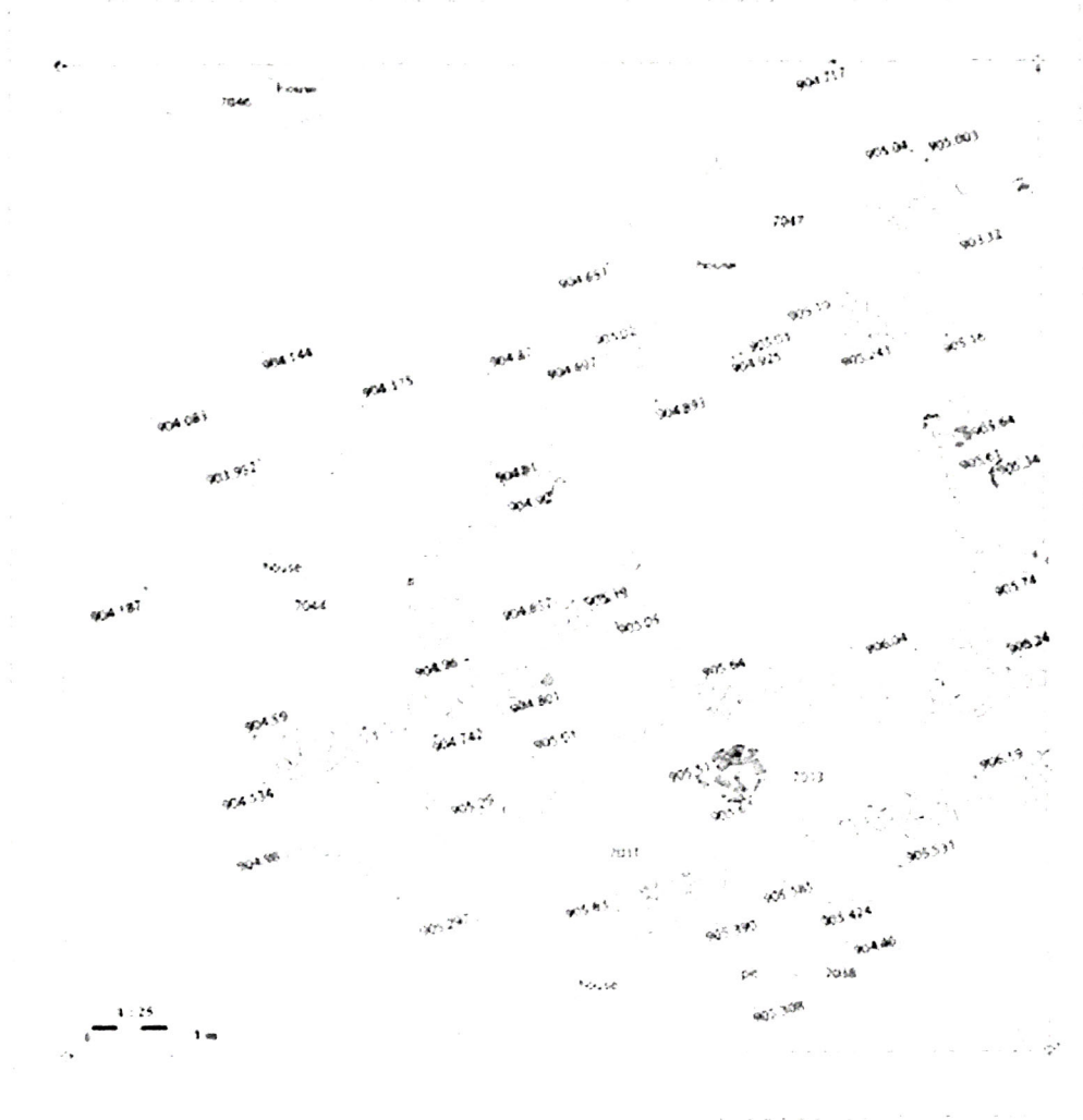
Şəkil 1. Ovçultərənin yarımqazma tipli evləri [Baxşəliyev vd. 2010].

yerində Son Neolit, Erkən Eneolit və Orta Eneolit dövründə məskunlaşdığını qeyd etmişdir [6, s. 1-18]. Naxçıvantərənin Son Neolit dövrünə aid sadə keramikası I Kültərə keramikası ilə əlaqələndirilmiş, basmanaxışlıların isə Qarabağ abidələri ilə bağlı olduğu qeyd olunmuşdur [6, s. 6-9]. Naxçıvanın Erkən Eneolit mədəniyyətinin Dalma Tərə tipli basmanaxışlı və boyalı keramika ilə xarakterizə edildiyi müəyyənləşdirilmişdir. Dalma Tərə boyalı keramikasının özünəməxsus xüsusiyyətləri ilə fərqlənməsinə baxmayaraq bu tip keramikanın formalaşmasına Xalaf və Ubeyd mədəniyyətinin təsir etdiyi söylənmişdir [6, s. 4-14].