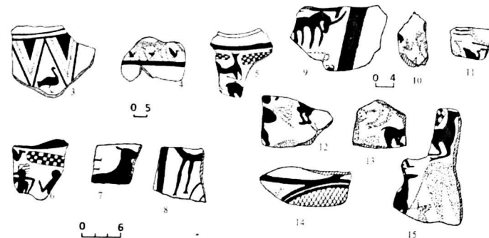
Şəkil 2. Polixrom boyalı keramika nümunələri. 3-I Kühltəpə; 1-2; 4-15-II Kühltəpə