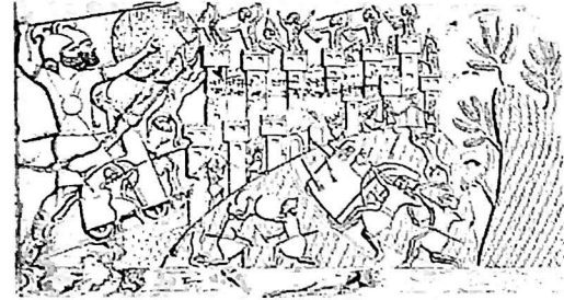
Şəkil 3. Dur-İllil qala-şəhəri uğrunda döyüş.

6. Dur-İllil ("Tanrı Enlilin qalası"). Sinah-heribin zamanında (e.ə. 705-681) Urartumeyilli qüvvələrin təzyiqlə Manna-Aşşur münasibətləri yenidən korlanı; mannallar, hətta, Aşşur əyaləti Zamuadadakı bir neçə qalanı (mənbələrdə adları göstərilmiş) zəbt edirlər. Bunun üçün orada Aşşur üsul-idarəsindən narazı olan yerli əhəlidən ibarət sosial baza mövcud idi. Belə ki, Dur-İllil şəhərinin sakinləri, digər yaşayış məskənlərinin (Bit-Sanqibutu, Simirra, Arka, Uşnu, Siannu və s.) əhali kimi hələ III Tiqlatpalasarin zamanında Aşşur dövləti üçün etibarsız olduqlarından iki mərhələdə yaşadıqları yerlərinə deportasiya olunmuşlar [1, s.55-56; 4, s.34].