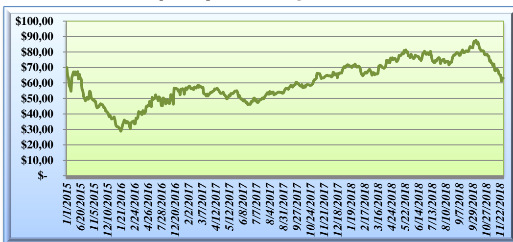
Цена нефти марки «AzeriLight» 2015-2018 гг.