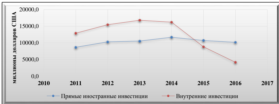
Динамика объёмов ПИИ и внутренних инвестиций в АР (9)

Так как инвестиции являются важной составляющей экономики любой страны, рассмотрим взаимосвязь инвестиций и важных макроэкономических показателей.