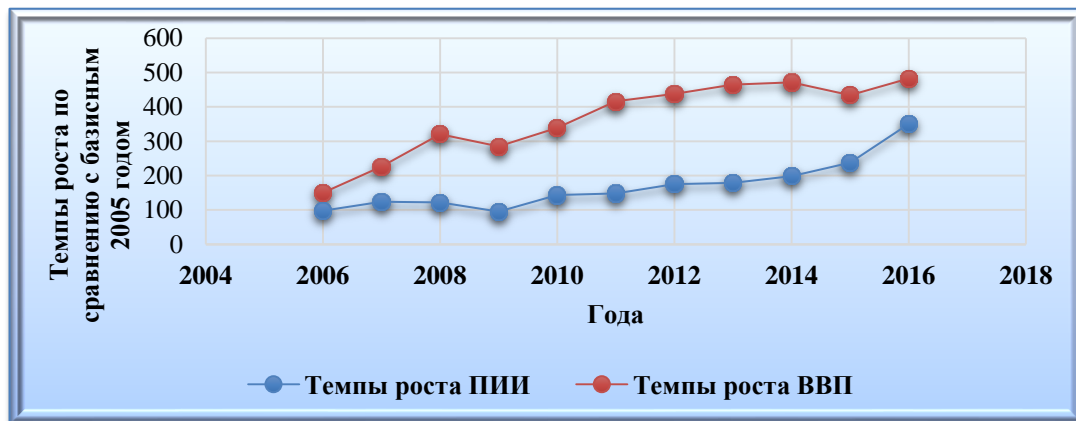
Динамика темпов роста ПИИ и ВВП Азербайджана (миллион манат) (9)

Несмотря на относительно невысокий уровень ПИИ, страны, представленные в таблице, отличаются достаточно высоким темпом роста ВВП, что подтверждает вышеизложенную теорию. Можно сделать вывод, что причинами роста ВВП при уменьшении доли инвестиций в его структуре могут быть: