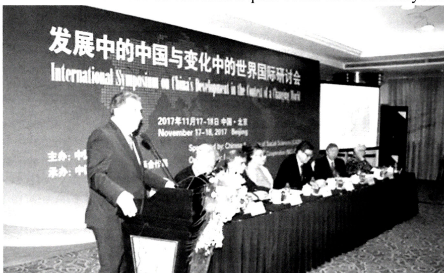
Şəkil 5. Akademik İsa Həbibbəylinin beynəlxalq elmi simpoziumda məruzəsi (Pekin, Çin)

rəhbərlə təmin ediləcək, doktorantlar təhsil müddətinin 2 ilini Monpelye Universitetində və 1 ilini AMEA-da tamamladıqdan sonra həm Azərbaycan,