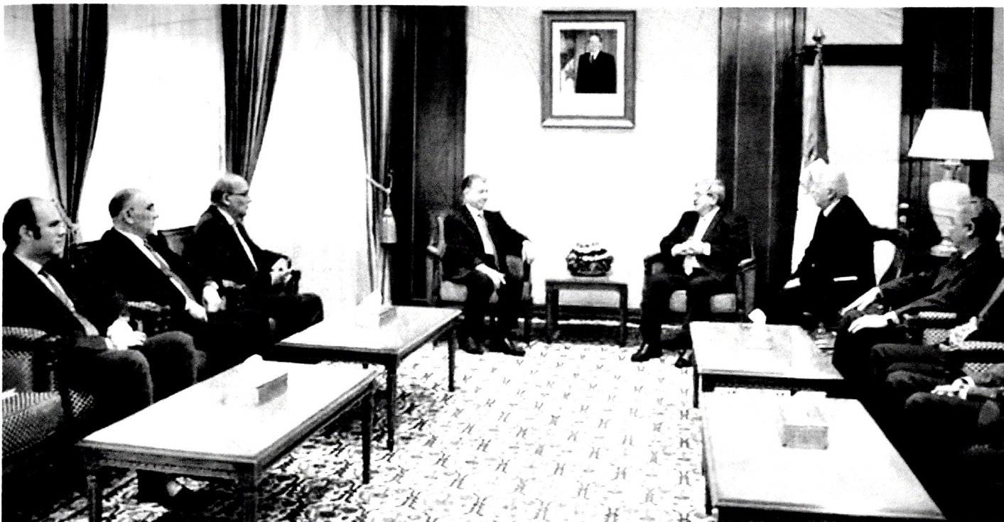
Şəkil 4. Əlcəzair Respublikasının Baş naziri cənab Əhməd Uyahya ilə görüş (Əlcəzair)

Azərbaycan Milli Elmlər Akademiyası ilə Çin İctimai Elmlər Akademiyası arasında əməkdaşlığın uğurlu davamı kimi hər iki akademiyanın İqtisadiyyat institutlarının təşkilatçılığı ilə Bakıda "Azərbaycan-Çin iqtisadi əməkdaşlığı" mövzusunda