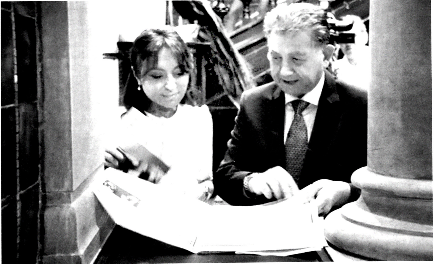
Şəkil 1. "Böyük Azərbaycan şairi Nizami" kitabının ingilis dilində ilk nəşrinin təqdimatı (London, Böyük Britaniya)

AMEA-nın prezidenti, akademik Akif Əlizadə, AMEA Rəyasət Heyətinin akademik-katibi, akademik Rasim Əliquliyev və AMEA Milli Azərbaycan Tarixi Muzeyinin direktoru, akademik Nailə Vəlixanlıdan ibarət nümayəndə heyəti Azərbaycanı və Qafqazı öyrənən Britaniya Fondunun Azərbaycanın və Böyük Britaniyanın yüksək rütbəli rəsmi nümayəndələri, Parlament və Lordlar Palatasının üzvləri, diplomatlar, bir sıra nüfuzlu beynəlxalq təşkilatların və müxtəlif akademik dairələrin təmsilçilərinin iştirakı ilə Londonda keçirilən təntənəli təqdimat mə-