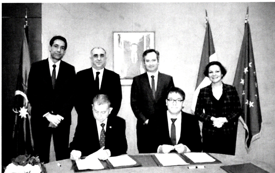
Şəkil 6. Azərbaycan Milli Elmlər Akademiyası və Monpelye Universiteti arasında əməkdaşlıq sənədlərinin imzalanması (Paris, Fransa)

geniş imkanlar yaradılır. AMEA elmi müəssisələrindən müxtəlif ölkələrdə qısa- və uzunmüddətli elmi ezamiyyətdə olan gənclər AMEA və Azərbaycan Respublikasının Prezidenti yanında Elmin İnkişafı Fondu ilə yanaşı, Erasmus+, Horizon-2020, Fulbright, Volkswagen Fondu və s. kimi beynəlxalq proqram və fondların dəstəyi ilə Avropa, ABŞ, Asiya, Afrika və MDB-nin müxtəlif ölkələrində beynəlxalq treninq kurslarda və elmi forumlarda iştirak etmiş, müştərək tədqiqat qruplarına daxil edilmişlər.