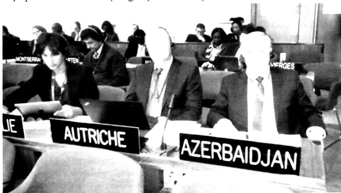
Şəkil 8. Akademik Dilqəm Tağıyevin UNESCO-nun Baş Konfransının 39-cu sessiyasında (Paris, Fransa)