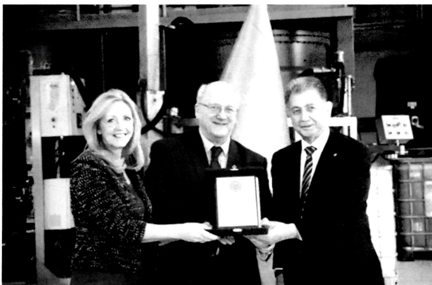
Şəkil 2. AMEA Yüksək Texnologiyalar Parkında Millers Oils Azərbaycan MMC-nin istehsalat kompleksinin açılışı (Bakı)

rasimində iştirak etmişlər. Akademik A.Əlizadə tədbirdə çıxış edərək Fondun Himayədarlar Şurasının sədri, İngiltərə-Azərbaycan Cəmiyyətinin həmsədri, akademik Nərgiz Paşayevanın təşəbbüsü ilə Oksford Universiteti nəzdində böyük Nizami Gəncəvinin adını daşıyan Mərkəzin yaradılması, həmçinin təşkil edilən təqdimat mərasiminin Böyük Britaniyada və Avropada Azərbaycanın milli dəyərlərinin təbliğ olunmasında xüsusi əhəmiyyətini vurğulamışdır. AMEA prezidenti Nizami Gəncəvi Mərkəzi tərəfindən şərqşünas-alim Yevgeni Bertelsin (1890-1957) ilk dəfə 1940-cı ildə rus dilində çap edilmiş “Böyük Azərbaycan şairi Nizami” (“The Great Azerbaijani Poet, Nizami”) kitabının ingilis dilində ilk nəşrinin təqdimat mərasimində də məruzə ilə çıxış etmişdir (şəkil 1).