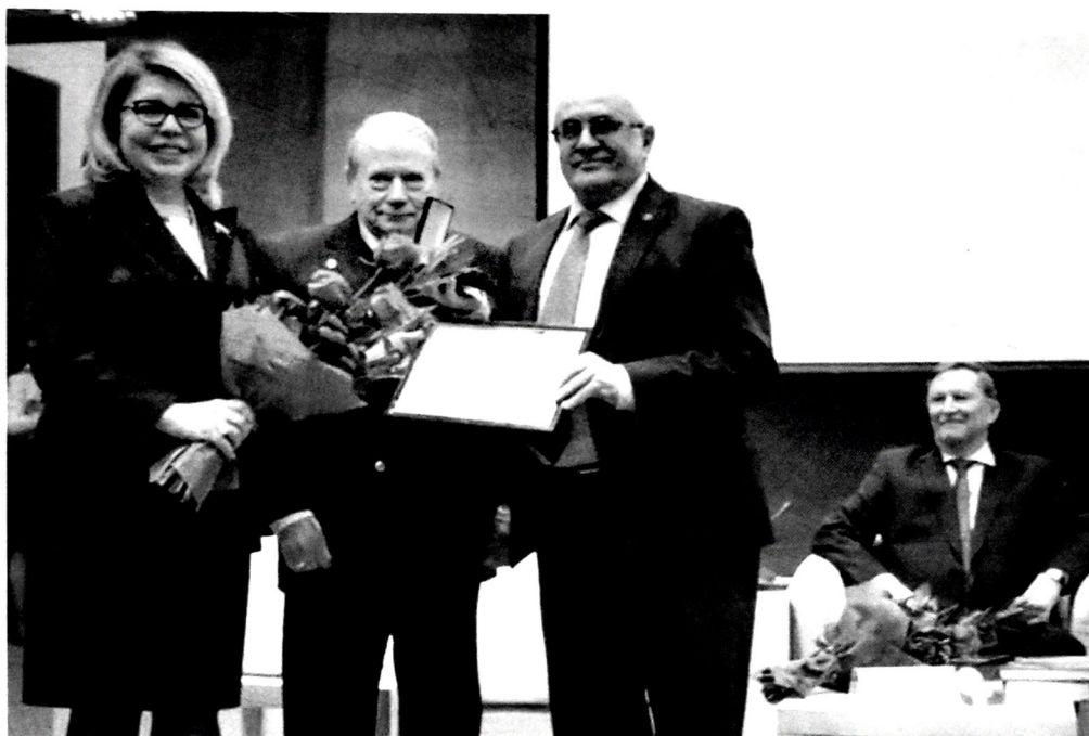
Şəkil 7. Akademik İbrahim Quliyevin beynəlxalq ekoloji mükafatla təltif edilməsi (Moskva, Rusiya)

UNESCO ilə müxtəlif istiqamətlər üzrə əməkdaşlıq AMEA alimləri üçün geniş imkanlar açır.