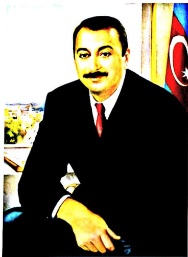
Şəkil 6. 7. Nikas Safronov. İlham Əliyevin portretləri

tonu oldu. Rəssamın Azərbaycanın, o cümlədən Naxçıvanın gözəl təbiət mənzərələrini ulu öndər Heydər Əliyev yüksək qiymətləndirirdi. Nikas Safronov Bakıda olarkən ulu öndərin, həmçinin Azərbaycanın tanınmış şəxsiyyətlərinin obrazlarını yaratmışdır. Bu sırada cənab İlham Əliyevin portretləri xüsusilə böyük maraq doğurur. Bakı şəhəri mənzərəsi, Azərbaycanın xəritəsi və bayrağı fonunda təsvir edilmiş bu portretlər təbii görünüşü, səmimiyyəti, rusiyalı rəssamın üslubuna xas olan aydın, realist dəst-xətti ilə seçilir [şək. 6, 7].