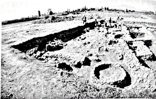
Рис. 1. Шабран. Общий вид одного из раскопок

пески превратили город в заброшенные руины» (9). Следует отметить и тот факт, что город Шабран располагался в центре плодородной равнины и после прекращения жизни в городе, его территория стала использоваться жителями соседних сёл под сельскохозяйственные угодья. Ежегодная вспашка и нивелировка под посевные площади быстро привели к исчезновению всех наземных признаков городской структуры. Вскоре местное население даже не помнило название этого города, считая, что здесь некогда находился легендарный город Гулистан Ирам. Впервые мысль о том, что вблизи села Шахназарли был расположен средневековый город Шабран, высказал А.А.Бакиханов, что впоследствии полностью подтвердили археологические раскопки (рис 1).