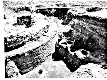
Рис. 3. Шабран. Раскопки крепостных стен участка были обнаружены закрытые подземные канализационные системы XI века (1) (рис.2,3,4,5).

Масштабные раскопки городища Шабран проводившиеся в конце прошлого века велись под руководством профессора Р.Б.Гюеюева. В начале XXI века раскопки городища Шабран были продолжены Ф.А.Аббасовой, а затем и автором данной статьи. В результате этих раскопок были выявлены и исследованы две шабранские крепости и городской замок XIV-XV вв., многочисленные жилые дома, хозяйственные постройки, мечети, христианские и зороастрийские храмы. Были раскопаны мощенные речным камнем улицы города разных периодов (XI-XII вв., XIV-XV вв.). Были обнаружены водопроводные системы из керамических труб, по которым вода с горных родников доставлялась в город. На некоторых раскопанных