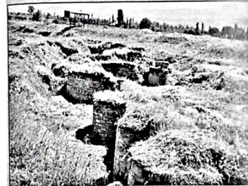
Рис. 2. Шабран. Общий вид замкового комплекса

Самый нижний относится к раннесредневековому периоду VI-VIII вв., второй относится к IX-XII вв., третий к XIII-XIV вв., а последний верхний горизонт характеризует городскую жизнь XV-XVIII вв (14).