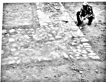
Рис. 4. Шабран. Фундамент оборонительной стены города X-XII в.в

кая степень развития самого разнообразного ремесленного производства на протяжении практически всего периода существования города. Об этом свидетельствуют как остатки самих производственных сооружений, так и наличие соответствующего для того или иного ремесленного производства инструментария, сырьевых заготовок, полуфабрикатов, производственного брака и шлака, а в редких случаях, и наличие готовой продукции. В ряде отраслей ремесленного производства, таких как изготовление керамических изделий, кирпича и других строительных материалов, кузнечного дела и др. наблюдается наличие производственных стандартов, что, несомненно, является характерной чертой товарного обращения.