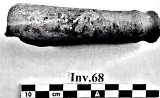
Рис. 5. Шабран. Фрагмент средневекового водопровода XI-XII в

Шабран заслуженно считается одним из ведущих центров керамического производства в средневековом Азербайджане. По мнению исследователей, керамические изделия Шабрана отличаются хорошим качественным обжигом, многообразием форм и размеров, что было связано с их функциональным назначением, и ярким орнаментальным оформлением. (рис. 6.7) Особо следует отметить поливную керамику, декоративное оформление которой свидетельствует по мнению специалистов не только о высоком уровне мастерства, но и о хорошем вкусе шабранских мастеров (18). На днищах многих керамических сосудов Шабрана имеются индивидуальные клейма мастеров. В культурном слое, датированным X-XIV вв., обнаружено 15 клейм, имеющих свои от-