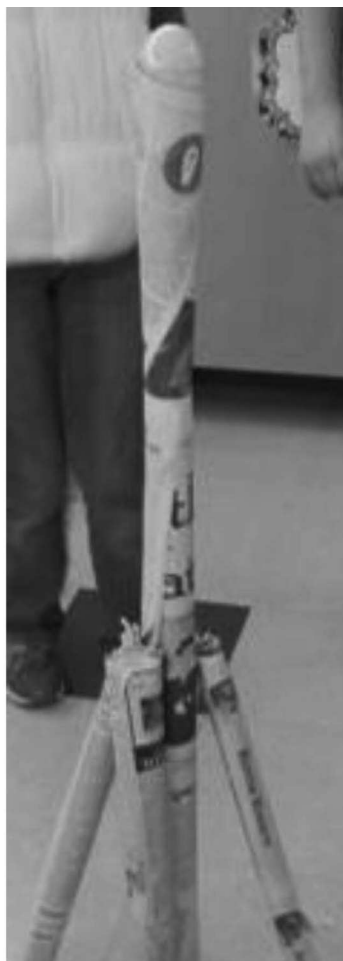
Şəkil 4. «Yumurta qüllə»nin modeli

Çünki qiymətləndirmənin əsas hədəfi şagirdləri ruhlandırmaq, onları psixoloji ruh düşgünlüyünə düşər etməmək olmalıdır.