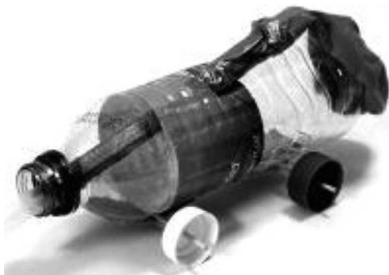
Şəkil 3. Hava şarılı ilə hərəkət edən maşının modeli

kömək göstərir. Məsələn, müəllim bu prosesin tərkib hissəsi olan plastik butulkanın deşilməsini həyata keçirə bilməyən qruplara köməklik göstərə bilər. Bundan başqa, o hər bir qrup üzvlərini bu prosesdə aktiv iştirak etməyə təhrik edir.