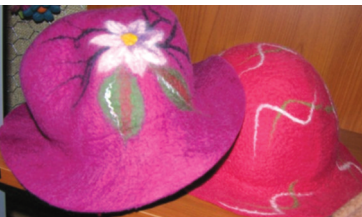
Şapka örnekleri ve Mevlevi başlıkları.