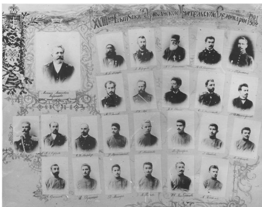
İrəvan Müəllimlər Seminariyasının 1902-ci il buraxılışı

Seminariyanın fəaliyyəti dövründə Məmmədbağır Qazızadə, Rəşid bəy Şahtaxtinski, Həmid bəy Şahtaxtinski, Cəfər bəy Cəfərov, Molla Məmmədbağır Qazızadə müsəlman şöbəsinin müdiri olmuşlar. Məmmədbağır Qazızadə, Mixail Klopov, Axund Məmmədbağır Kazımxadə (tatar (Azərbaycan) dili müəllimi), Firidun bəy Köçərli (1885-1895, ana dili və şəriət müəllimi), Mirzə Məmmədveli Qəmərli (1901-1911), Rəhim Xəlilov (1903, Azərbaycan dili müəllimi), Rəşid bəy Şahtaxtinski (1903, Azərbaycan dili müəllimi), Mirzə Cəfər Məmmədov (1911-1917, Azərbaycan dili müəllimi), Məmməd Axundov, K.Şulkin, Axund Məmmədbağır Tağızadə, Mirzə Məmmədveli Qəmərinski, Həbib bəy Səlimov (idman müəllimi), Məmməd Əliyev seminariyada müəllim işləmişlər. İrəvan Müəllimlər Seminariyasının məzunu Cabbar Məmmədov 1913-cü ildə seminariyada tatar dili (Azərbaycan dili – İ.B.) müəllimi işləmişdir.