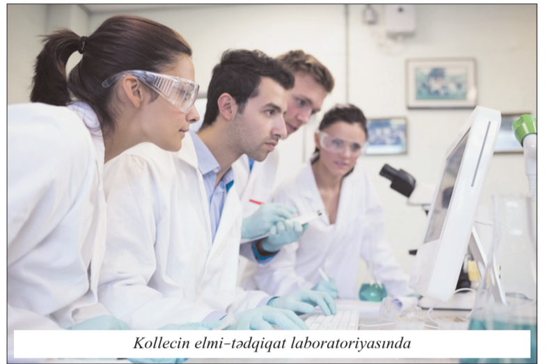
Kollecin elmi-tədqiqat laboratoriyasında