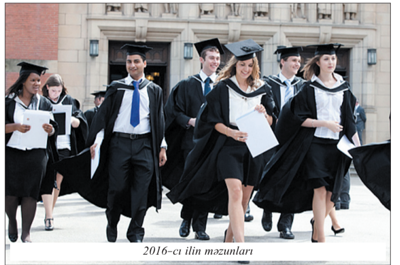
2016-cı ilin məzunları