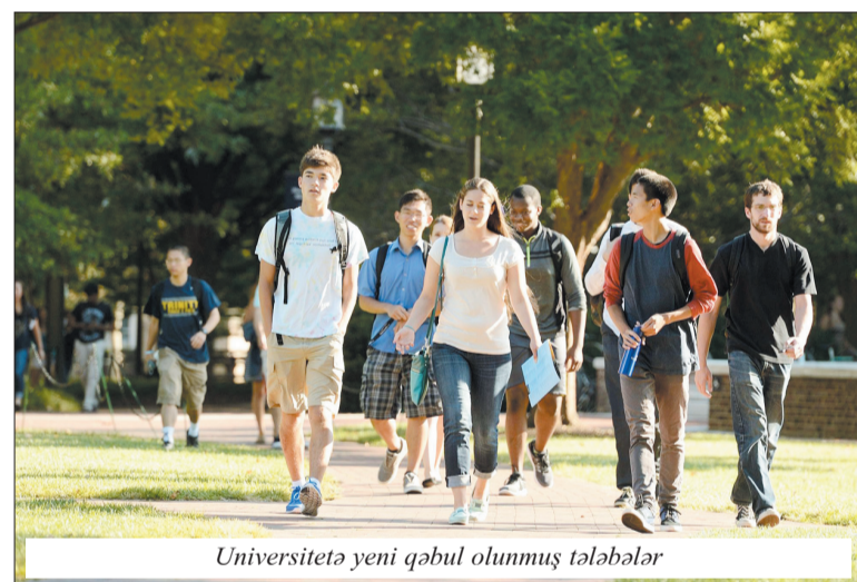
Universitetə yeni qəbul olunmuş tələbələr

(TOEFL-600 bal, IELTS- 7 bal) üzrə test nəticələrini təqdim etməlidirlər. Sənədlər yanvarın 1-ə kimi təhvil verilməlidir.