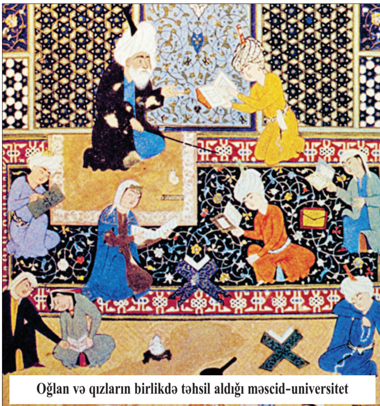
Oğlan və qızların birlikdə təhsil aldığı məscid-universitet