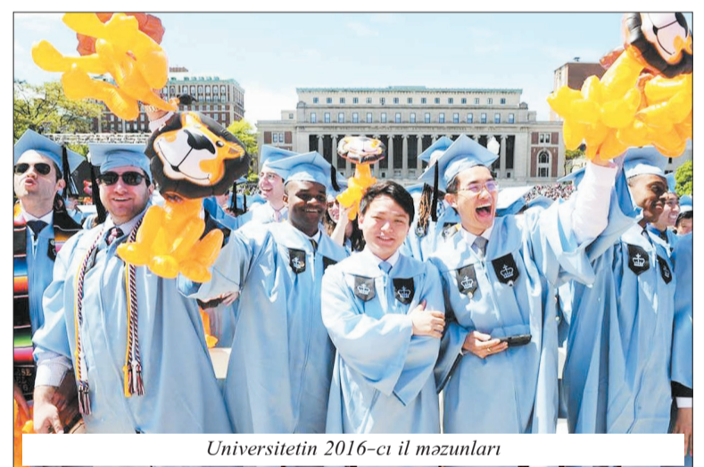
Universitetin 2016-cı il məzunları

dımlardan yararlanır. Yardım zərfi 30000 dollar təşkil edir. Universitetin məzunlarının 95 faizi ali məktəbi bitirdikdən ilk 6 ay sonra yüksək məaşı işlə təmin olunur.