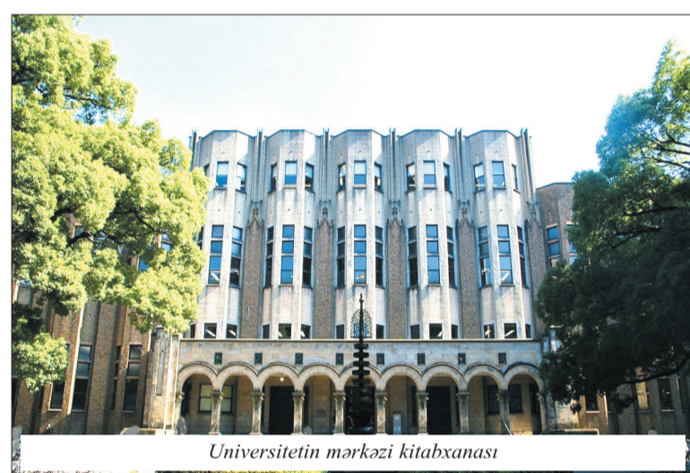
Universitetin mərkəzi kitabxanası