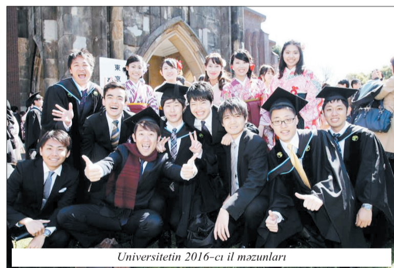
Universitetin 2016-cı il məzunları

tədris ili aprelin 1-dən martın 31-ə kimi davam edir. Bütün əcnəbi tələbələr yapon dilindən əvvəl yazmalı və ümumi fənn biliklərinə dair testdən keçməlidirlər. Dillə bağlı problemləri aradan qaldırmaq üçün universitet nəzdində yaradılmış xüsusi kurslardan keçmək olar.