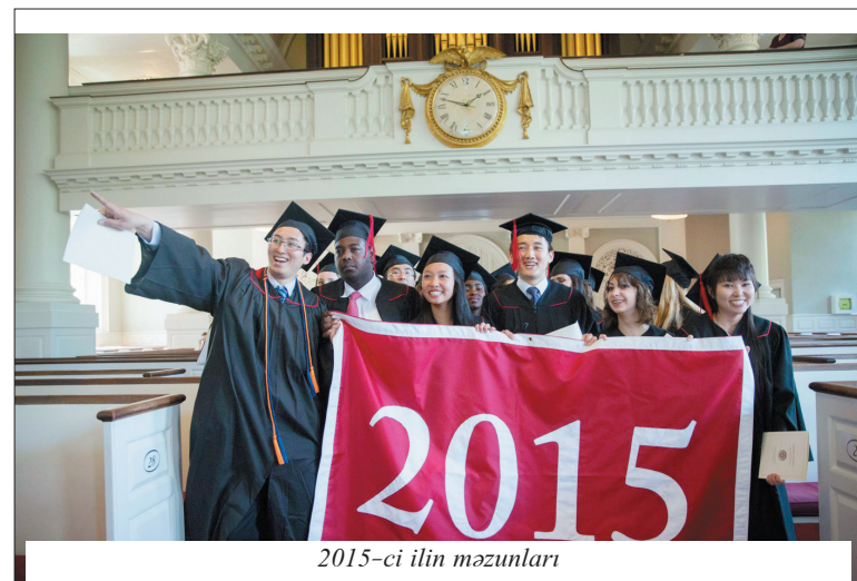
2015-ci ilin məzunları

edirlər. Universitetdə 400-dən çox tələbə təşkilatı fəaliyyət göstərir.