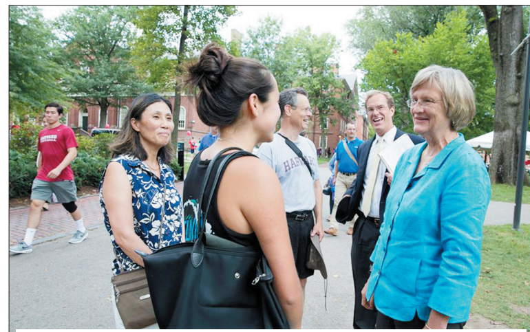
Harvardın Prezidenti yeni tələbələr və onların valideynləri ilə görüşür