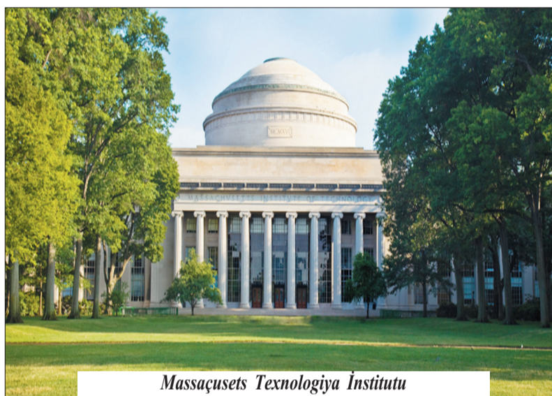
Massaçusets Texnologiya İnstitutu