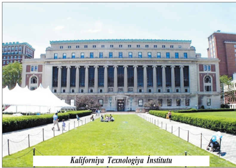
Kaliforniya Texnologiya İnstitutu