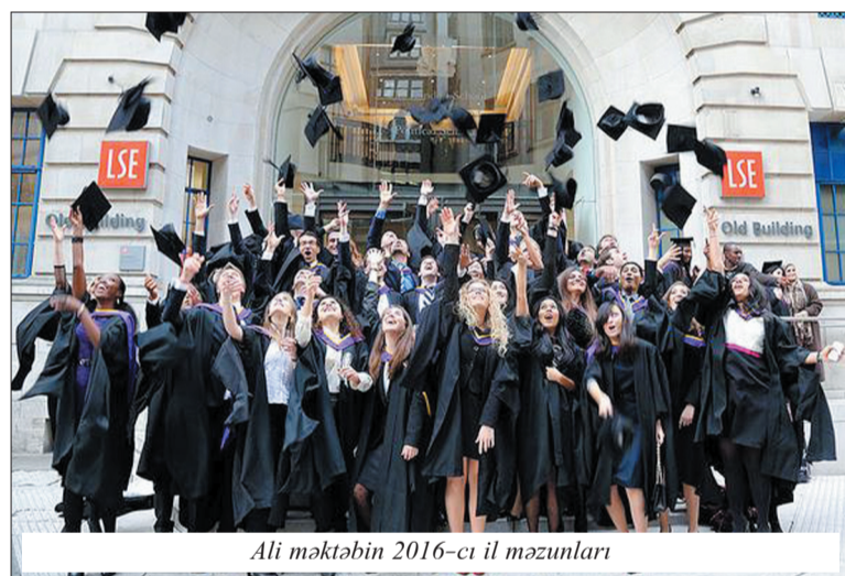
Ali məktəbin 2016-cı il məzunları

London İqtisadiyyat və Siyasi Elmlər Məktəbinin təqaüdləri aztəminatlı ailələrdən olan tələbələr üçün nəzərdə tutulub. Yerli tələbələr üçün 3 illik proqram üzrə təqaüdü məbləği 7500 funt-sterlinq təşkil edir. Ali məktəbin təqaüdünün maksimal məbləği ildə 2500 funt-sterlinqdir. Biznes fənləri üzrə təhsil alanlara ildə 5444 funt-sterlinq məbləğində Stelios təqaüdü verilir.