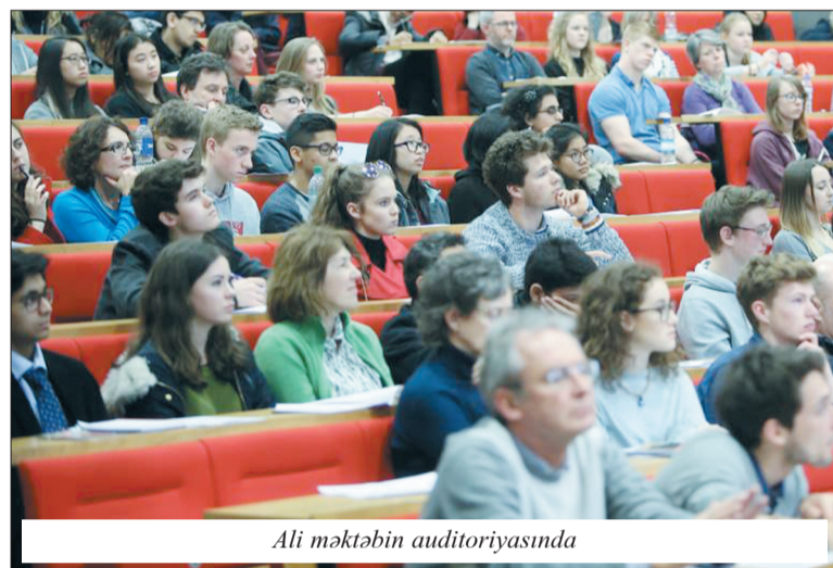
Ali məktəbin auditoriyasında