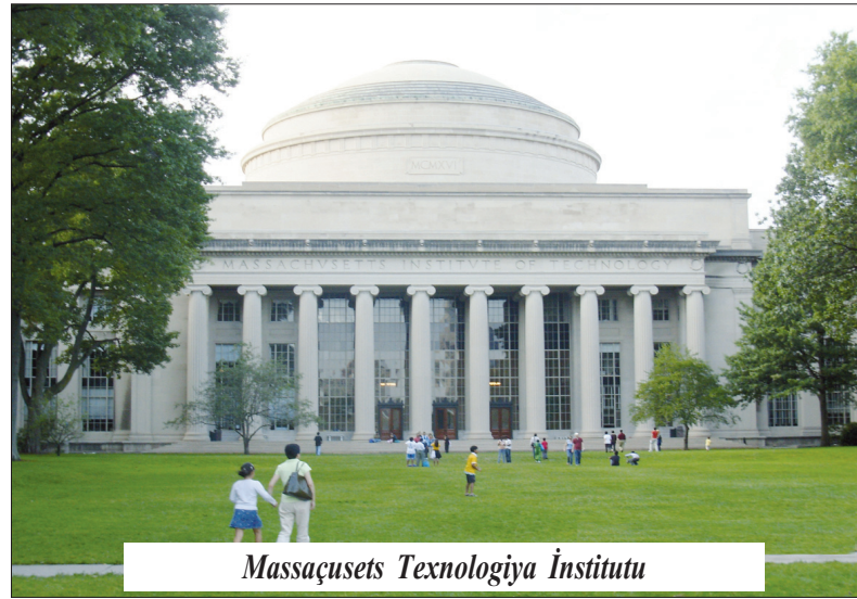
Massaçsets Texnologiya İnstitutu