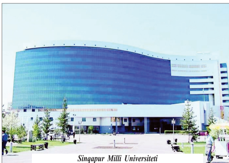
Sinqapur Milli Universiteti