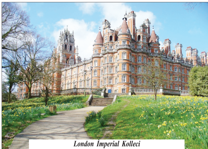
London İmperial Kolleci