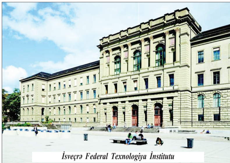
İsveçrə Federal Texnologiya İnstitutu