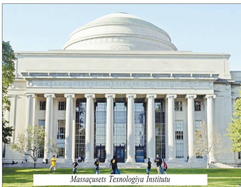
Massaçusets Texnologiya İnstitutu