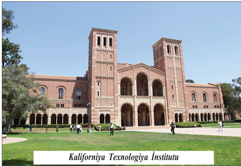
Kaliforniya Texnologiya İnstitutu