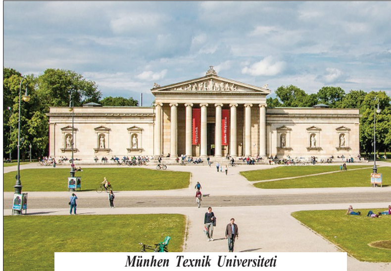
Münhen Texnik Universiteti