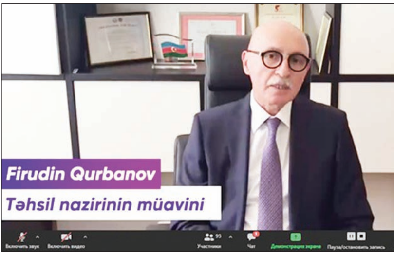
Firudin Qurbanov Təhsil nazirinin müavini

2019-2020-ci tədris ilində bakalavr və magistratura səviyyələri üzrə 450-yə yaxın gənc məzun oldu