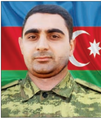
texnikası" ixtisası üzrə bakalavr səviyyəsində qiymətli təhsilə baş-

2020-ci ildə ali məktəblərə keçirilən imtahanların nəticələrinə görə, Sumqayıt Dövlət Universitetinin tələbəsi adını qazanmışdı. "İnformasiya və kompüter