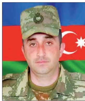
hüseyn adına Şirvan kənd tam orta məktəbində işə başlayıb, uşaqlarla məktəbdənkənar və siftdənkənar tərbiyə işi üzrə təşkilatçı vəzifəsində.

29 yaşlı təhsil işçisi Oğuz rayonunun Xaçmaz kəndində doğulub. Kənddəki V.İbrahimov adına tam orta məktəbdə oxuyub. Azərbaycan Dövlət Pedaqoji Universitetində Təhsilin təşkili və idarə olunması ixtisasına yiyələnib. Naxçıvanda Tank əleyhinə batareyada hərbi xidmət keçdikdən sonra Ə.Abdul-