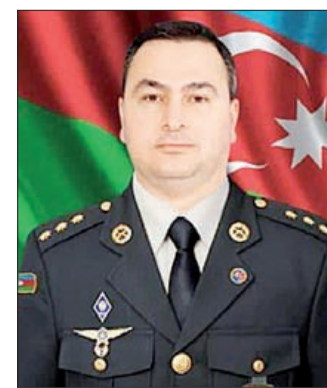
vəzifəsi Vətən müharibəsi kö-nüllüsü olub. 2020-ci ildə səfərbərlik elan olunanda bir çox könüllü kimi ehtiyatda olan baş leytenantın da müraciəti dəyə-r-

O, 1997-ci ildə Dövlət İdarəçilik Akademiyasını qırmızı diplomla bitirib. Elə o vaxtdan İsmayıl rayonu E.Məmmədov adına 3 nömrəli məktəb-liseyde tarix müəllimi idi. Fəaliyyətinin ilk günlərindən şagirdlərinin və müəllim kollektivinin rəğbətini qazanıb. Qısa zamanda rayonun tanınmış simasına çevirilib, rayon tədbirlərini idarə edib. Son