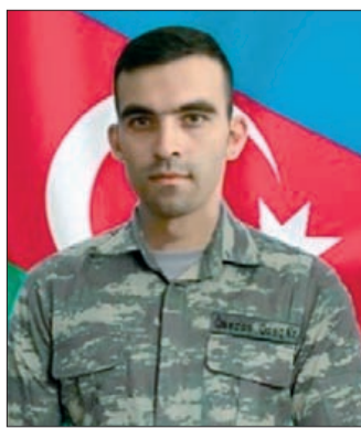
qəsində 57 bal toplayaraq riyaziyyat müəllimi kimi sinif girmək hüququ əldə etmişdi. Azərbaycan Dövlət Pedaqoji Universitetində bakalavr, Memarlıq və İnşaat Uni-

2018-ci ildən müəllim idi. Müəllimlərin işə qəbulu müsabi-