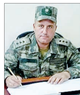
sində tabor komandiri vəzifəsində döyüşlərə qatılıb. Cəbrayılın və Qubadlının azadlığında gedən döyüşlərdə savaşıb,

2020-ci il sentyabrın 27-də başlayan II Qarabağ müharibə-