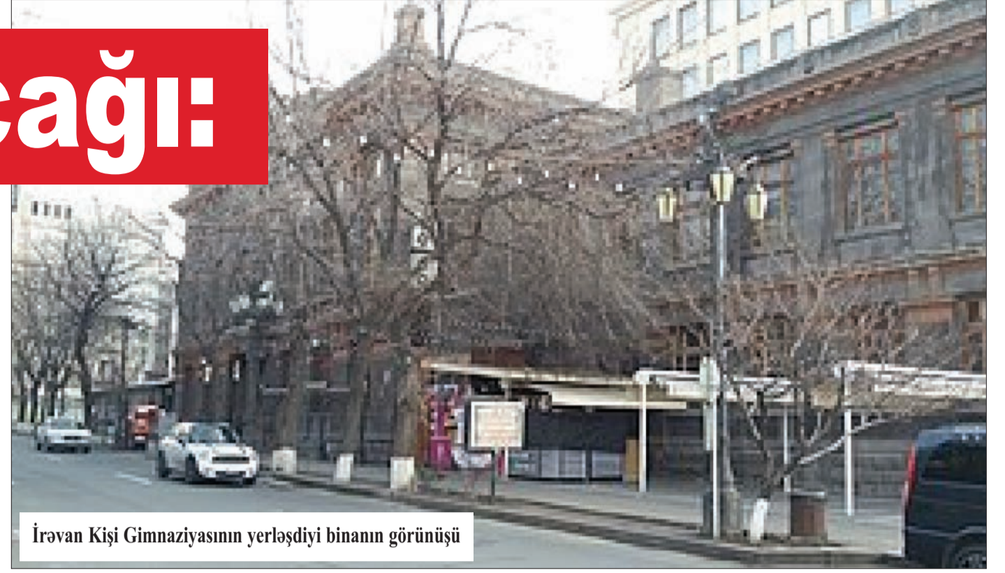
İrəvan Kişi Gimnaziyasının yerləşdiyi binanın görünüşü