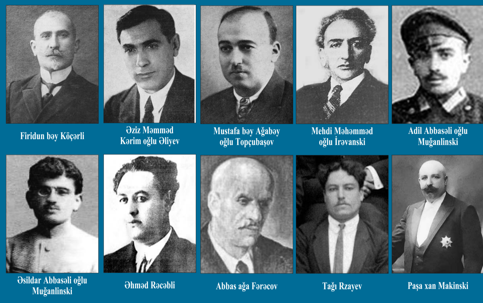
Firidun bəy Köçərli