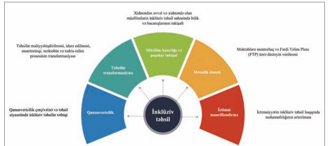
İnklüziv təhsilin səmərəli tətbiqində əsas faktorlar

2021-ci ildə aparılan tədqiqat Azərbaycanda inklüziv siniflərdə təhsil alan əlilliyi olan şagirdlərin sosial münasibətlər baxımından uğur əldə etdiklərini və yaşadıkları tərəfindən təcrid olunmadıklarını göstərib. Ümumilikdə, layihə çərçivəsində həyata keçirilən peşəkar inkişaf proqramları, monitorinqlər, maraqlı tərəflərlə (mentorlar, direktorlar, müəllimlər, valideynlər və s.) təşkil olunan müzakirələr və görüşlər, aparılan mentorluq prosesi aşkar edib ki, ümumi təhsil müəssisələrinin pedaqoji və inzibati heyətinin təlimləndirilməsi daxil olmaqla onlara metodiki dəstəyin göstərilməsi, valideynlər və təhsilalanlara inklüziv təhsil mədəniyyətinin aşılması və ona qarşı müsbət münasibətin yaradılması məktəbdə inklüziv təhsilin düzgün təşkili və ümumi inklüzivlik ab-havasının təmin olunmasında mühüm rol oynayır. Eyni zamanda ehtiyaclarına uyğunlaşdırılmış fərdi inkişaf və təlim proqramını tətbiq etməklə əlilliyi olan şagirdlərin mənəvi və məzmunlu təhsilinə nail olmaq və psixososial sağlamlığına dəstək vermək mümkündür. Bu, öz növbəsində həmin uşaqların sosial həyata inteqrasiyası üçün lazımı imkan yaradır.