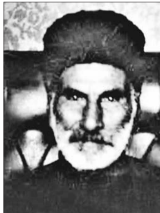
Həşim bəy Nərimanbəyov