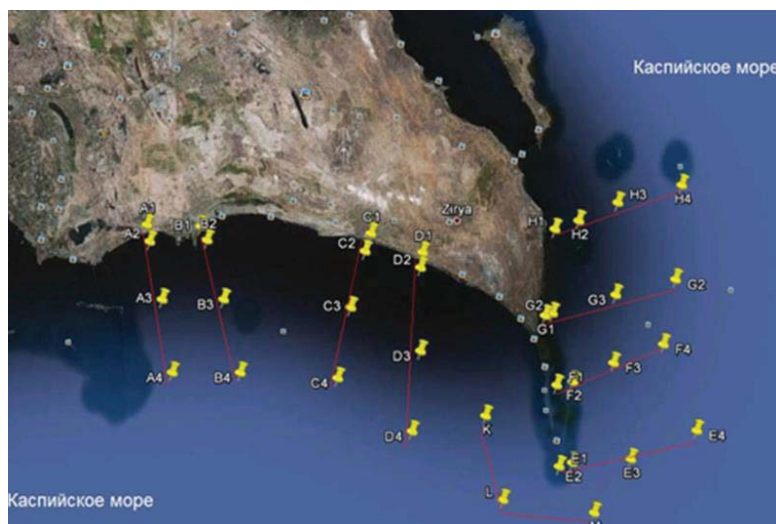
Рис. 1. Изображение расположения точек отобранных образцов.

Результаты анализа распределения углеводородов нефти в донных отложениях представлены в таблице 3 и рис.3. Количество нефтяных углеводородов в пробах изменялись от 1,9 мкг/г до 1387 мкг/г в перерасчете на сухой вес. В таблице 1 указано, количество содержания углеводородов нефти в пробах ( C_1 - C_4 ), в них концентрации несколько высоки по сравнению с другими областями изучаемой территории Каспийского моря. Причиной этому является увеличение промышленного развития за последние годы. Количество углеводородов нефти в пробах ( C_1 - C_4 ) больше чем в других образцах, данные пробы были собраны близко к берегу. Наибольшее количество углеводородов нефти определено в точках А3, В3, С3 и D3.