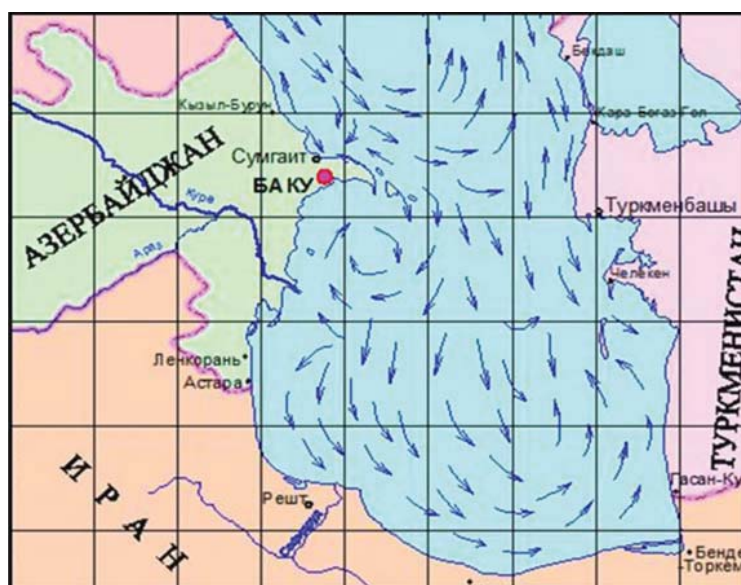
Рис. 2 Изображение схемы течения в Каспийском море