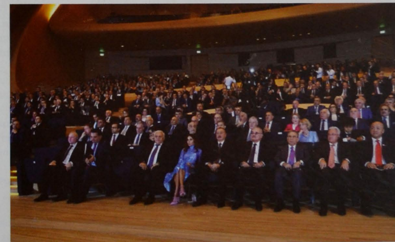
Şəkil 12. AÇG üzrə yeni müqavilənin imzalanması mərasimi