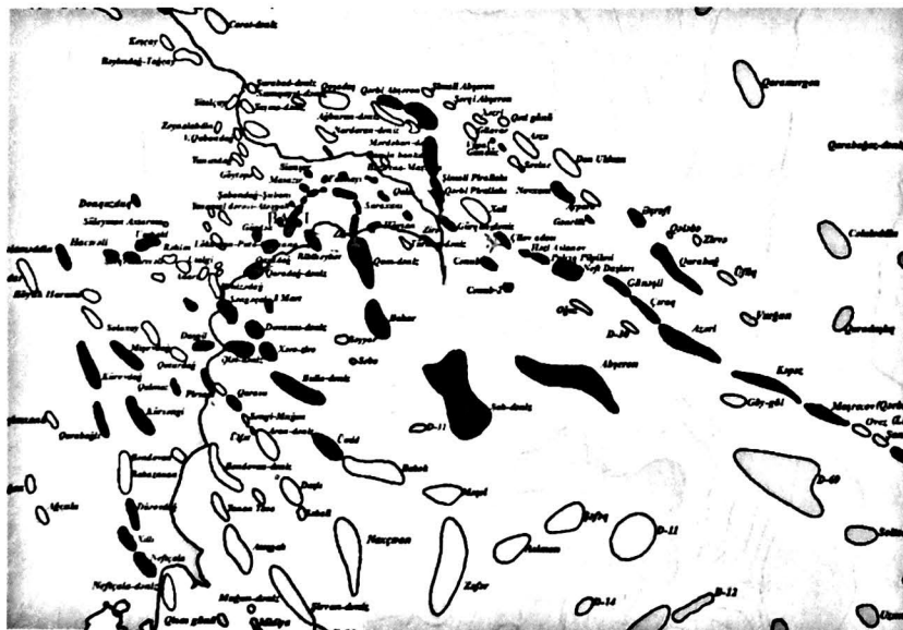
Şəkil 1. Neft-qaz yataqları və strukturlar

Azərbaycan Respublikası Dövlət Neft Şirkətinin birinci vitse-prezidenti, Azərbaycan Milli Elmlər Akademiyasının akademiki