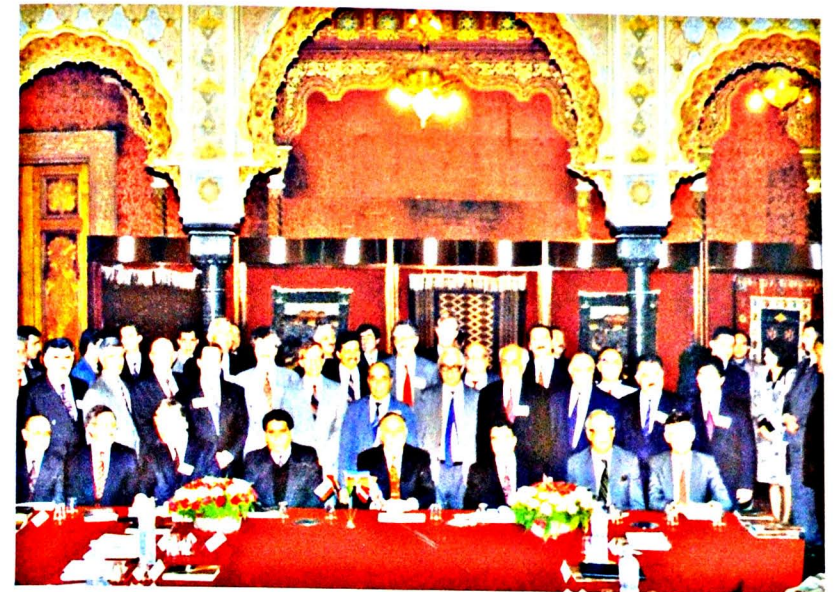
Şəkil 9. 1994-cü il, Bakı. "Əsrin Müqaviləsi" imzalandıqdan sonra Rəhbər Komitənin birinci iclasında

yandırılıydı, biz yeddi-səkkiz il gözləməli olacaqdıq. Nümayəndə heyətimizin üzvü, o vaxt ARDNŞ-in xarici əlaqələr üzrə vitse-prezidenti vəzifəsində çalışan cənab İlham Əliyev qarşımıza qoyulmuş şərt barədə ulu öndərimizə məlumat verdi, onun göstərişi ilə Vaşinqtona uçdu, orada çox faydalı görüşlər keçirib, məsələni yoluna qoydu.