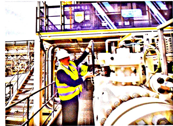
Şəkil 14. Cənub Qaz Dəhlizinin rəsmi açılışı