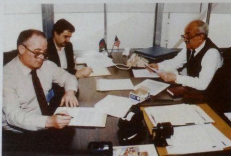
Şəkil 4. ABŞ, 1992-ci il. "AMOKO" şirkətində "Əsrin Müqaviləsi"nin texniki cəhətdən əsaslandırılması sahəsində gərgin iş gedir.

Lakin 1992-ci ildə Azərbaycanda hakimiyyətin dəyişməsi "Azəri" yatağı üzrə xarici şirkətlərlə müqavilənin imzalanmasını təxirə saldı. Lakin həmin ilin sentyabrında Azərbaycan Respublikası Dövlət Neft Şirkəti (ARDNŞ, 2015-ci ildən SOCAR) yaradıldı və xarici şirkətlərlə danışıqlar davam etdirildi. 1992-ci ilin sonlarında "Azəri" yatağı üzrə danışıqlara Xəzərin Azərbaycan sektorundakı "Çıraq" yatağı da cəlb