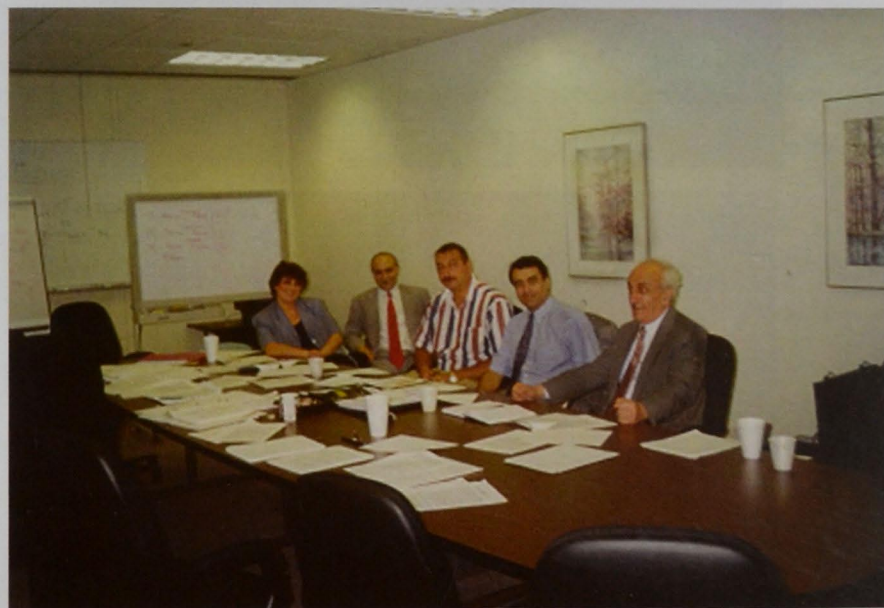
Şəkil 5. ABŞ, 1994-cü il. "Əsrin Müqaviləsi"nin Hyustonda müzakirəsi.

Danışıqlar 1994-cü ilin martında Bakıda başlandı, sonra Türkiyənin İstanbul şəhərində davam etdirildi. Danışıqların həlledici mərhələsi Amerikanın Hyuston şəhərində keçirildi. Buradakı danışıqlarda layihəyə "Azəri" və "Çıraq" yataqları ilə yanaşı "Günəşli" yatağının dərsulu hissəsini də qoşmaq qərara alındı. Hyustonda 1994-cü il iyulun 21-dən sentyabrın 4-dək 45 gün ərzində aparılan danışıqlarda kəskin dramatik məqamlar az olmadı (şəkil 5). Danışıqlar ağır gedirdi. Tərəflərin hər biri öz mövqeyini, öz mənafeyini qoruyurdu. Bəzən iş o yerə çatırdı ki, ya qarşı tərəf, ya da Azərbaycan tərəfi danışıqları tamamilə dayandırmaq fikrinə düşürdü. Bir dəfə qarşı tərəf şart qoydu ki, Azərbaycan Rusiya ilə danışıb, Xəzər