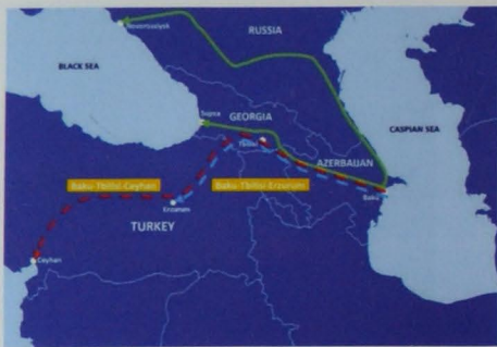
Şəkil 11. Azərbaycanla neft və qaz ixrac yolları

Bu variantların hər biri döndə-döndə təhlil edildi. Axırda biz BP şirkəti və onun tərəfdaşları ilə işin təklif etdiyimiz kommersiya şərtləri əsasında davam etdirilməsini üstün tutduq. Ona görə ki, 1994-cü ildən AÇG-də işləyən BP və onun tərəfdaşları bu yataqlara, onların xüsusiyyətlərinə dərin bələd olmuşlər. BP ilə məsləhətləşmələr, danışıqlar aparıldı. Onlar da əməkdaşlığı davam etdirməkdə maraqlı olduqlarını bildirdilər. Danışıqlarımız 2017-ci il sentyabrın 14-də Bakının Heydər Əliyev Mərkəzində AÇG yataqlarının birgə işlənməsi haqqında düzəliş edilmiş və yenidən tərtib olunmuş müqavilənin imzalanması ilə