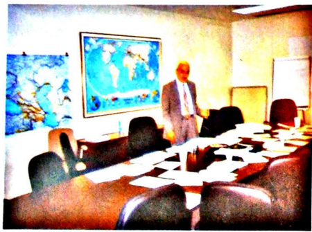
Şəkil 6. 1994-cü il. "Əsrin Müqaviləsi"nin üzərində iş

dənizinin hüquqi statusunu həll etməsə, danışıqlar davam etdirilməyəcək. Təsəvvür edirsinizmi, bu nə demək idi? Məlum olduğu kimi, Rusiya ilə bu məsələ Prezident Heydər Əliyevin səyi nəticəsində yalnız 2002-ci ildə həll edildi. Deməli, 1994-cü ildə Amerikanın Hyuston şəhərində danışıqlar da-