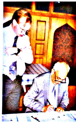
Şəkil 7. 20 sentyabr 1994-cü il, Bakı. "Əsrin Müqaviləsi" imzalanarkən

dənizinin hüquqi statusunu həll etməsə, danışıqlar davam etdirilməyəcək. Təsəvvür edirsinizmi, bu nə demək idi? Məlum olduğu kimi, Rusiya ilə bu məsələ Prezident Heydər Əliyevin səyi nəticəsində yalnız 2002-ci ildə həll edildi. Deməli, 1994-cü ildə Amerikanın Hyuston şəhərində danışıqlar da-