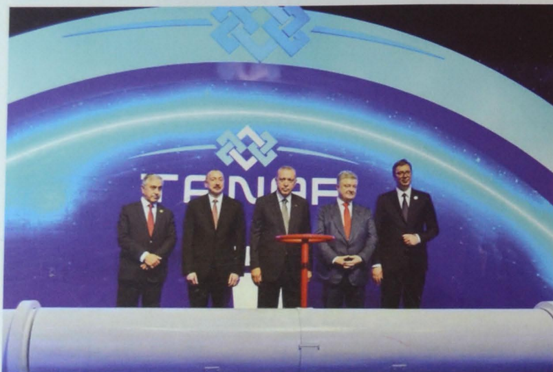
Şəkil 15. Trans-Anadolu Təbii Qaz Boru Kəmərinin təntənəli açılışı

Türkiyə Prezidenti Rəcəb Tayyip Ərdoğanın, Ukrayna, Serbiya, Şimali Kipr respublikaları rəhbərlərinin iştirakı ilə "Cənub" Qaz Dəhlizinin 2000 km hissəsinin – TANAP adı ilə məşhur olan Trans-Anadolu Təbii Qaz Boru Kəmərinin təntənəli açılışı oldu (şəkil 15). Beləliklə də "Şahdəniz" qazının Cənubi Qafqaz ixrac boru kəməri və TANAP vasitəsilə Türkiyəyə nəqlinə başlandı. İndiyədək TANAP kəmərinə 2 mlrd. m 3 -dən çox "Şahdəniz" qazı vurulmuşdur.