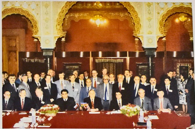
Şəkil 2. 1994-cü il, Bakı, “Əsrin Müqaviləsi” imzlandıqdan sonra Rəhbər Komitənin birinci iclasında

Məhz buna görədir ki, Ulu öndər 2001-ci ildə 20 sentyabr tarixinin Azərbaycan neftçilərinin peşə bayramı kimi qeyd olunması barədə fərman verdi.