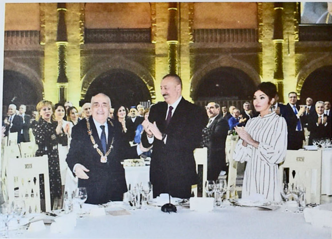
Şəkil 11. "Buta Palace" konsert-banket kompleksi, 2020-ci il, İlham Əliyev "Heydər Əliyev" ordenini təqdim edərkən

Son bir il mənim də həyatımda unudulmaz, qürurverici bir hadisə ilə yadda qalıb. Bu il 14 yanvarda mənim 90 illik yubileyim ölkə Prezidentinin sərəncamı ilə böyük təntənə ilə qeyd edildi (şəkil 11).