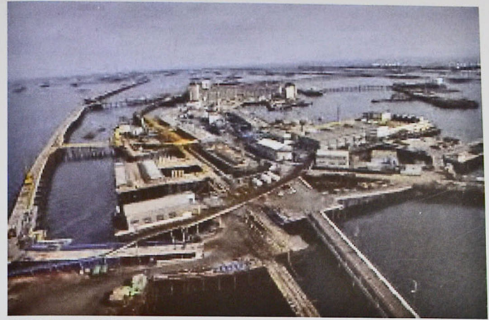
Şəkil 7. Əfsanəvi "Neft Daşları"

Keçən dövr ərzində əlamətdar hadisələrdən biri də 2019-cu il noyabrın 6-da Əfsanəvi "Neft Daşları"-nin 70 illik yubileyinin təntənəli qeyd edilməsidir (şəkil 7, 8, 9).