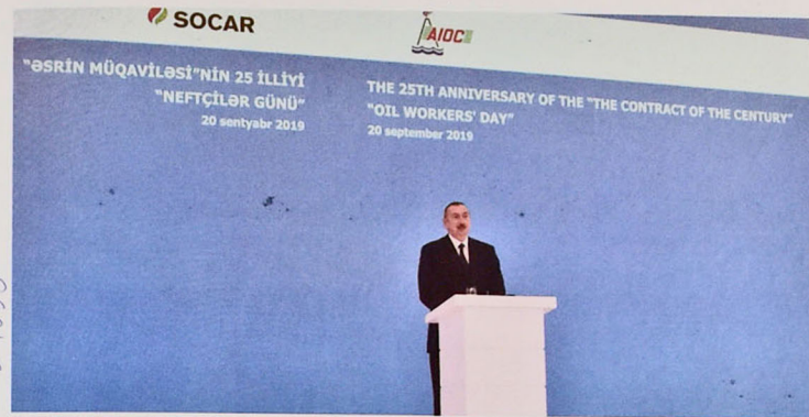
Figure 6. 25th anniversary of the "Contract of the Century", Oil Workers Day

On September 20, 2019 with the participation of the President of the Republic of Azerbaijan Ilham Aliyev the 25th anniversary of the "Contract of the Century" was solemnly celebrated at Heydar Aliyev Center. At the event Mr. Ilham Aliyev made a report on the history, economic and political significance of the "Contract of the Century" and stressed the joint importance of SOCAR and foreign companies (Figure 6).