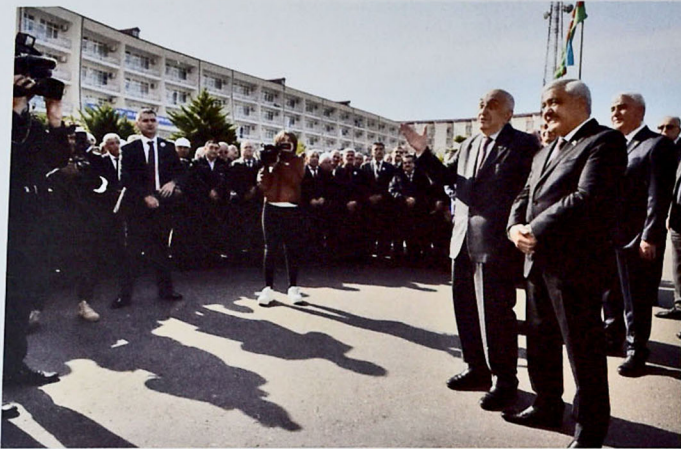
Şəkil 9. "Neft Daşları"nın 70 illik yubileyi tədbirlərində

dənizdə istismar olunan ilk yataq olduğunu, bu yatağın işlənməyə verilməsi ilə neft sənayesinə verdiyi töhfənin əvəzəlməz olduğundan, oradakı iş fəaliyyətim və xatirələrimdən danışdım. Qeyd etdim ki, işlənmənin əvvəlindən yataqdan təxminən 176.4 milyon ton neft və 14 milyard kubmetr qaz hasil edilmişdir. Hazırda yataqda illik neft hasilatı 945-950 min ton, qaz hasilatı isə 85 milyon kubmetr həcmindədir. Bu yataq Azərbaycanı dənizdə neft hasilatının vətəni, "Neft Daşları"nı isə dünyanın 8-ci möcüzəsi kimi tarixə salmışdır. "Neft Daşları" yatağının kəşfinin və işlənilməsinin Azərbaycanda neft sənayesinin inkişafında və dünyanın yanacaq-energetika potensialının artırılmasında rolu barəsində aşağıdakı fikirlərimi diqqətə çatdırdım.