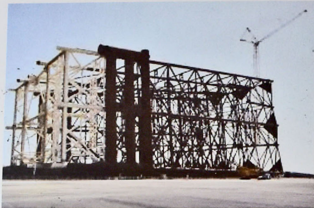
Figure 10. Garabagh field jacket

The scientists and specialists of both our institute and other scientific enterprises operating in the state conduct scientific research and achieve positive results.