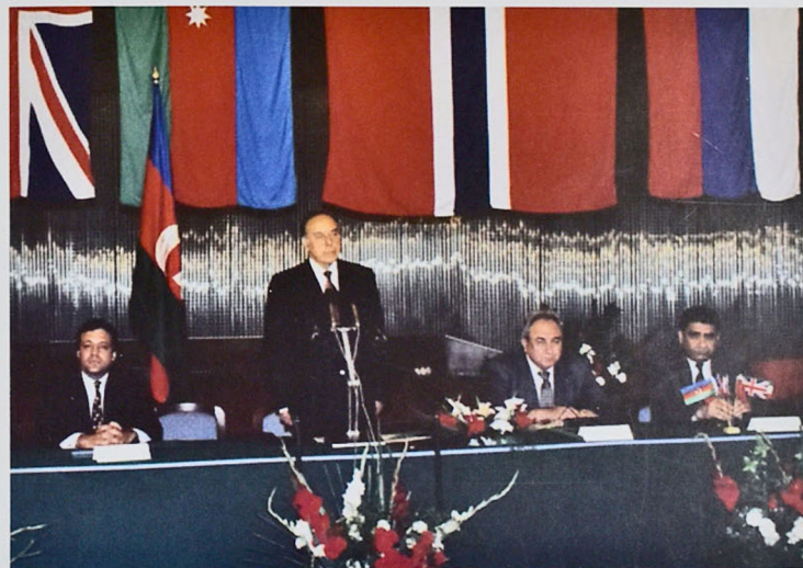
Figure 1. Signing the "Contract of the Century"

The role of the "Contract of the Century" signed on September 20, 1994, in the economic and political life of Azerbaijan is undeniable, as the main components of it were the hard work, political will, personal authority and respect of the National Leader Heydar Aliyev (Figures 1, 2).