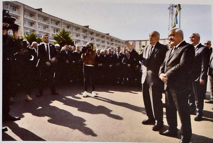
Figure 9. The 70th anniversary of Oil Rocks

production is 945–950 thousand tons, and gas production is 85 million m 3 . The field is like the 8th wonder of the world; it has made Azerbaijan the homeland of offshore oil production. I expressed some views on the role of the discovery and development of Oil Rocks in oil industry in Azerbaijan and in increasing the world's fuel and energy potential: