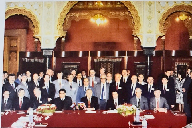
Figure 2. The first meeting of Steering Committee after the signing of the "Contract of the Century". Baku, 1994.

The National Leader issued a decree in 2001, to mark September 20 as the professional holiday of Azerbaijani oil workers.