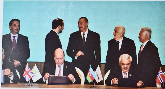
Şəkil 4. AÇG üzrə yeni müqavilənin imzalanması

Müqavilənin iqtisadi əhəmiyyəti isə odur ki, neft hasilatı Azərbaycanın tarixində ən aşağı səviyyədən – 1997-ci ildəki 9 milyon tondan 2010-cu ildə 51 milyon tona çatdı. Beləliklə, neft hasilatı 5.6 dəfə artdı. Bu layihə hələ çox illər Azərbaycan iqtisadiyyatına öz töhfəsini verəcəkdir. Belə ki, 2017-ci il sentyabrın 14-də Bakının Heydər Əliyev Mərkəzində "Azəri-Çıraq-Günəşli" yataqlarının birgə işlənməsinə dair 1994-cü ildə 30 il müddətinə bağlanmış sazişin, yəni "Əsrin müqaviləsi"nin vaxtının uzadılması haqqında müqavilə imzalandı (şəkil 4).