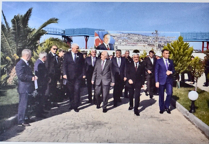
Figure 8. The 70th anniversary of Oil Rocks

production is 945–950 thousand tons, and gas production is 85 million m 3 . The field is like the 8th wonder of the world; it has made Azerbaijan the homeland of offshore oil production. I expressed some views on the role of the discovery and development of Oil Rocks in oil industry in Azerbaijan and in increasing the world's fuel and energy potential: