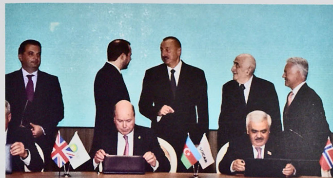
Figure 4. Signing a new ACG agreement

It also had great economic benefits. The Contract provided an opportunity to increase oil and gas production. The production of oil was increased from 9 million tons in 1997 to 51 million in 2010. It means that oil production increased by 5.6 times. This project will contribute to the economy of Azerbaijan for many years. Thus, on September 14, 2017 an agreement was signed at Heydar Aliyev Center in Baku to extend the 30-year agreement signed in 1994, the "Contract of the Century" on joint development of the ACG field (Figure 4).