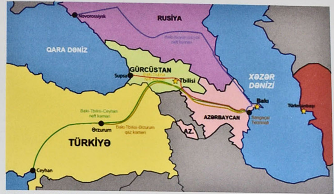
Şəkil 5. Bakı-Tbilisi-Ceyhan əsas ixrac boru kəməri

"Əsrin müqaviləsi"nin ən böyük nailiyyətlərindən biri də odur ki, bu müqavilə yalnız AÇG yataqlarının işlənməsi ilə məhdudlaşmadı. Bu böyük layihənin tövəmələri meydana gəlirdi ki, onların da birincisi Bakı-Tbilisi-Ceyhan əsas ixrac neft kəməri oldu (şəkil 5).