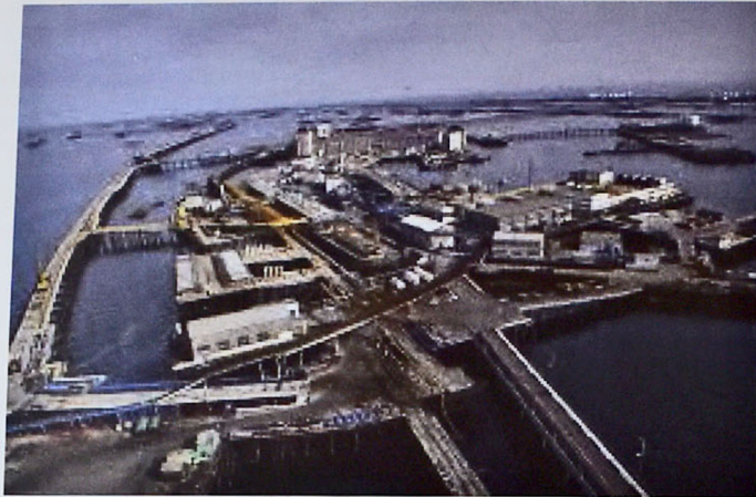
Figure 7. The Legendary Oil Rocks