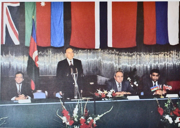
Şəkil 1. “Əsrin Müqaviləsi”nin imzalanma mərasimi

Azərbaycan Respublikasının iqtisadi-siyasi həyatında Yeni Neft Strategiyası, onun əsas tərkib hissəsi olan Ulu öndər Heydər Əliyevin gərgin zəhmətinin, siyasi iradəsi, şəxsi nüfuz və hörmətinin sayəsində 1994-cü il sentyabrın 20-də imzalanmış “Əsrin Müqaviləsi”nin rolu danılmazdır (şəkil 1,2).