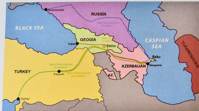
Figure 5. Baku-Tbilisi-Ceyhan main export pipeline

If the "Contract of the Century" was National Leader Heydar Aliyev's first masterwork, BTC - main oil export pipeline was his second one.