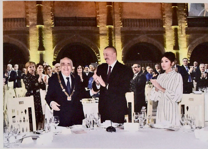
Figure 11. Buta Palace concert-banquet complex. Ilham Aliyev presents Heydar Aliyev Order, 2020.

At the ceremony attended by our esteemed President Ilham Aliyev and his wife, First Vice President Mehriban Aliyeva, once again mentioned my services in the oil industry and addressed very kind words to me. In my