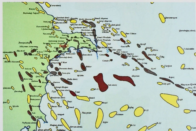
Şəkil 3. Xəzərin Azərbaycan sektorunda neft-qaz yataqları və strukturları

Beləliklə də, 20 sentyabr günü Azərbaycan iqtisadiyyatında, ölkəmizin ictimai-siyasi və sosial həyatında parlaq bir səhifə açmış Xəzərin Azərbaycan sektorunda yerləşən “Azəri-Cıraq-Günəşli” yataqlarının birgə işlənməsi üzrə imzalanmış “Əsrin müqaviləsi”nə və ümummilli liderin neft-qaz strategiyasını var qıvına ilə həyata keçirən neftçilərin əməyinə verilən yüksək dəyər in rəmzi oldu (şəkil 3).