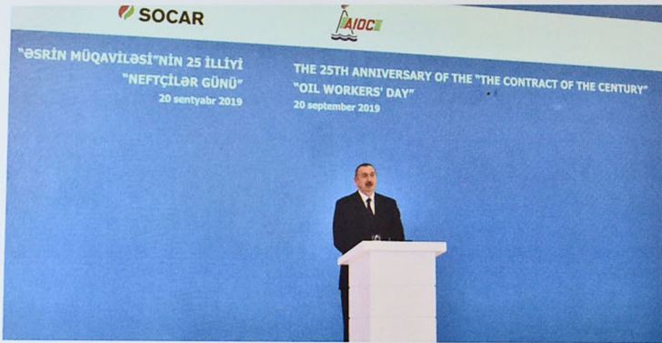
Şəkil 6. "Əsrin Müqaviləsi"nin 25 illiyi, "Neftçilər günü"

2019-cu il sentyabrın 20-də Azərbaycan Respublikasının Prezidenti İlham Əliyevin iştirakı ilə "Əsrin Müqaviləsi"nin 25 illiyi Heydər Əliyev Mərkəzində təntənəli surətdə qeyd edildi. Tədbirdə cənab İlham Əliyev "Əsrin müqaviləsi"nin tarixi, iqtisadi-siyasi əhəmiyyətini barədə mürəzzə ilə çıxış etdi və SOCAR ilə xarici şirkətlərin birgə fəaliyyətinin əhəmiyyətini vurğuladı (şəkil 6).